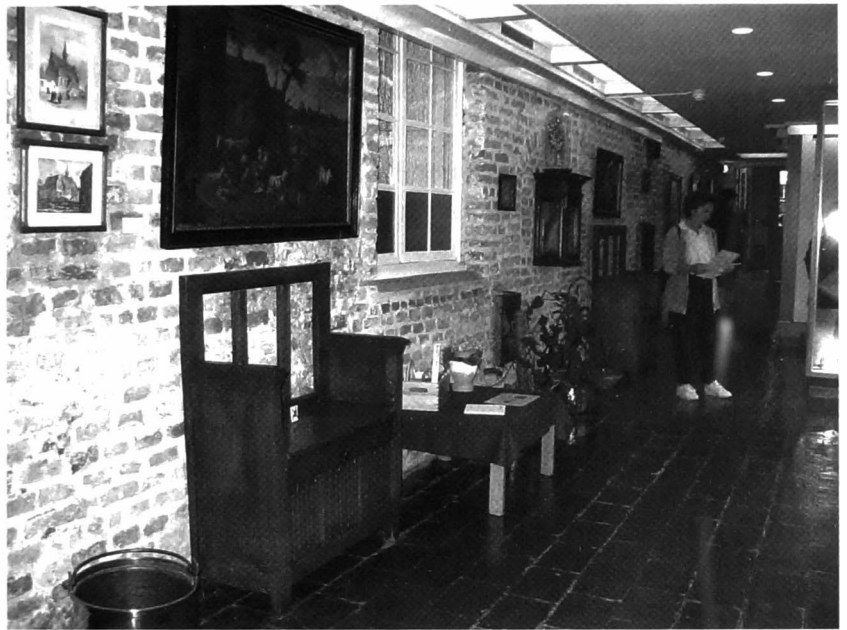
Algemeen zicht in de eerste museumzaal.