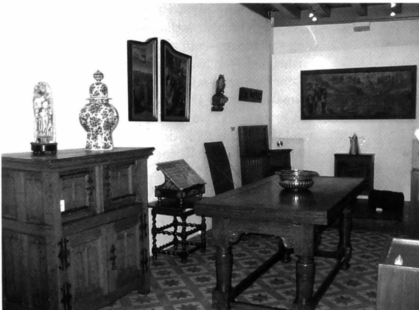
Zicht op het kleine bovenzaaltje.

In 1902 liet Opdedrinck een beperkte catalogus drukken bij van de Vyvere-Petyt. Hij bestond in het Nederlands ("Naamlijst", 14 blzn.) en in het Frans ("Catalogue") en geeft een overzicht van de tentoongestelde stukken (met uiterst bondige beschrijving). In die kleine brochure staan de openingsuren van het startende museum (op dinsdag en donderdag, telkens van 9 tot 11 en van 3 tot 5). Het museum werd opengehouden door de zusters Augustinessen (een van hen was daarvoor aangeduid). Van bij het begin (en tot in 1963) werd een gastenboek bijgehouden. Toch is het moeilijk na te gaan hoeveel bezoekers precies het museum bezocht hebben en we weten evenmin hoe zo'n bezoek verliep. Geduldig doorbladeren van het gastenboek levert natuurlijk wel enkele interessante details op: in de beginperiode kwamen jaarlijks zo'n 250 bezoekers over de vloer, ook klassen en vriendenkringen (vb. kunstenaarsgroepen). Verenigingen komen in het gastenboek vanaf de jaren 30 voor. Van bij het begin was er ook wat buitenlandse interesse, vooral vanuit Engeland. In 1950 tellen we bijna 850 namen in het boek. Uit een bedankingsbriefje vanwege een leraar en zijn klas kunnen we afleiden dat Pastoor Opdedrinck soms geleide bezoeken gaf.