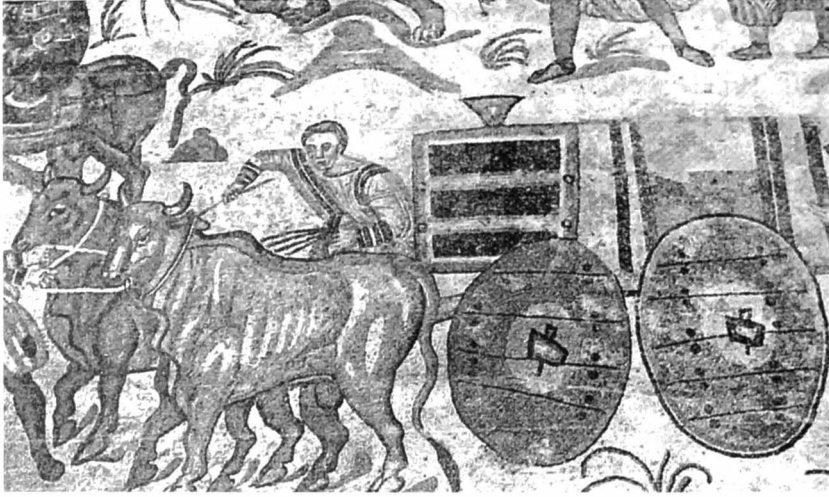
L. Devliegheer (p. 251): Kar met meerplankswielen. Romeinse mozaïek (4de eeuw) Piazza Armerina (Sicilië).