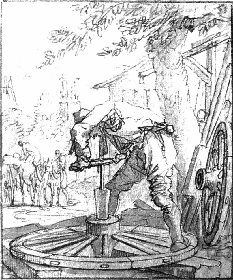
L. Devliegheer (p. 253): De wagenmaker boort met een schoeper het naafgat van een wiel. J. en C. Luiken, Het Menselyk Bedrijf, 1694.