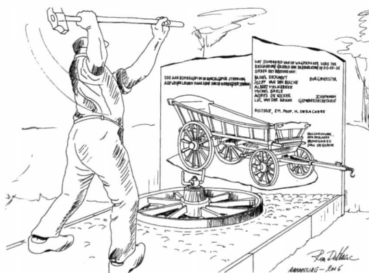
Silhouet van het monument.