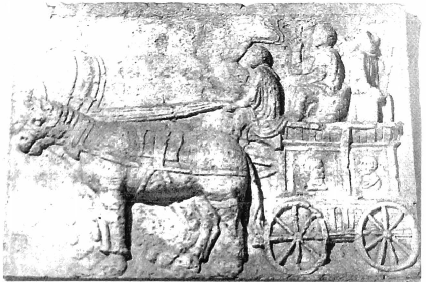
Reliëf met een carruca, een veel gebruikte reiswagen. Musée Calvet Avignon

uitstraling dat de weg haar naam draagt en het zou wenselijk zijn dat dus deze naam verbonden wordt met het bronzen gedenkteken. Maar, "DE" Hundelgemse Steenweg op zichzelf is zeker geen geschikt en illustratief object om in het bronzen beeld voorgesteld te worden. Wel kan er gebruik gemaakt worden van de uitbeelding van bepaalde activiteiten die met de heerwegen verbonden waren. Oorspronkelijk aangelegd voor leger- en militaire doeleinden, werden ze vlug volledig ingeschakeld in het post- en goederenverkeer per koets of per wagen. Aangezien het hier meestal grotere afstanden betrof, dienden op regelmatige afstanden rustplaatsen voorzien te worden waar de reizigers eten en onderdak konden vinden, waar de vermoeide paarden konden gevoederd en uitgewisseld worden tegen frisse uitgeruste paarden en waar desnoods herstelwerken aan de rijtuigen en ander tuig konden worden uitgevoerd.