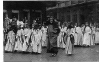
Heilige Bloedprocessie Brugge, 1919

Kindengelen drukken eenvoud en schoonheid uit als kenmerk van God. Theologisch gezien voelt men in deze woorden de hoge achting voor kinderen in het evangelie weerklinken. In een sfeer van vertrouwelijke intimiteit lijken de kindengelen speelkameraadjes voor het