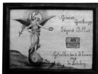
Loting 3 februari 1908, Ledeberg, gemeente Gentbrugge

In 1938 heeft de eerste opvoering van het Heilig Bloedspel plaats op de Markt, vlakbij het belfort. Een tweede reeks opvoeringen wordt in 1939 gegeven, een derde reeks in 1947 als dankzegging voor de bevrijding van Brugge na Wereldoorlog II. In 1952, 1957 en 1962 vinden de volgende opvoeringen plaats. De start van de restauratie van het belfort in 1965 en het toenemend verkeer in het stadscentrum roepen de