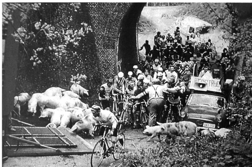
Koers en kermis horen samen in Vlaanderen: Beroepsrenners te Humbeek 1978 (Foto E. Mariën, in Jacobs & Van Doome 1979:162).