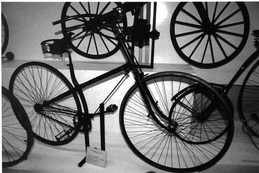
Veiligheidsfiets "Adler" (Duitsland) ca. 1888.

Men schetst een degelijk beeld van de evolutie van de fiets, van bij de oorsprong tot nu. Het museumbeleid stelt zich tot doel de evolutie van de fiets te blijven volgen door het handhaven van een collectie- en