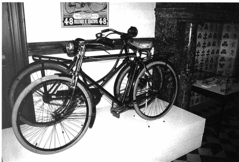
Herenfiets, Cyrille Van Hauwaert (België) ca. 1935.

aan de periode van de hoogbloei van de wielerveden. Het romantische verhaal wordt af en toe geconfronteerd met een vleugje harde realiteit. De wetenschap en techniek oefenen invloed uit op de evolutie van de fiets als instrument dat de competitiefeer binnen het sportieve gebeuren beïnvloedt. De technische opgang van de fiets, de inbreng van de wetenschap, het sportieve element, het fietsen als hobby en recreatie, het competitief fietsen, doping en dopingcontrole, worden in de museumopstelling op gelijke voet behandeld. Het stelt de bezoeker in staat om een eigen oordeel te vormen over de verschillende items die in het museum worden getoond.