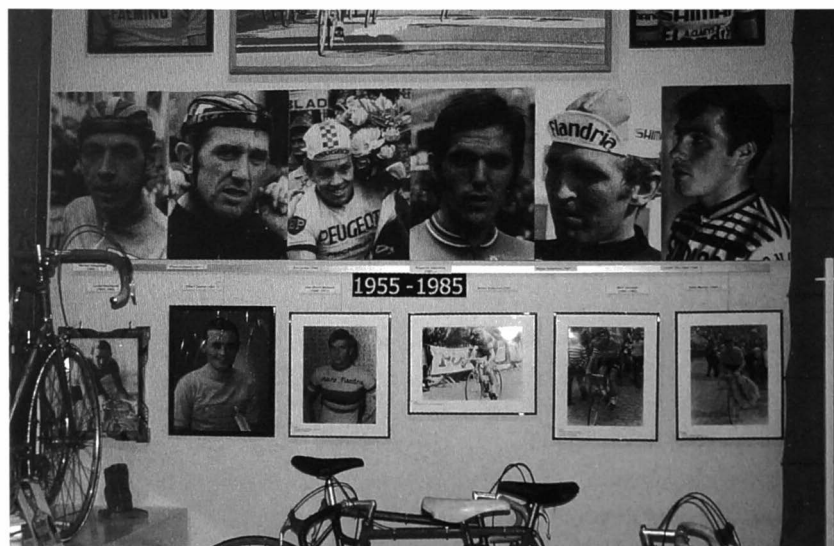
Eregalerij met van links naar rechts Herman Vanspringel (1943-), Frans Verbeeck (1941-), Eric Leman (1946-), Roger De Vlaeminck (1947-), Walter Godefroot (1943-) en Lucien Van Impe (1946-).

Het museum confronteert de reële wielerwereld met de tot de verbeelding sprekende geschiedenis van de Vlaamse wielersport. Het plaatst de geschiedenis van de Vlaamse wielrennerij in een ruimer historisch kader en geeft een boeiende, visuele synthese van de fiets-geschiedenis. Actuele gegevens en historie - de fantasie van de toeschouwer ontvangt af en toe een ondeugende prik - vullen elkaar prachtig aan. Het occasionele optreden van wielergod Freddy Maertens, permanent museummedewerker, is de kers op de taart.