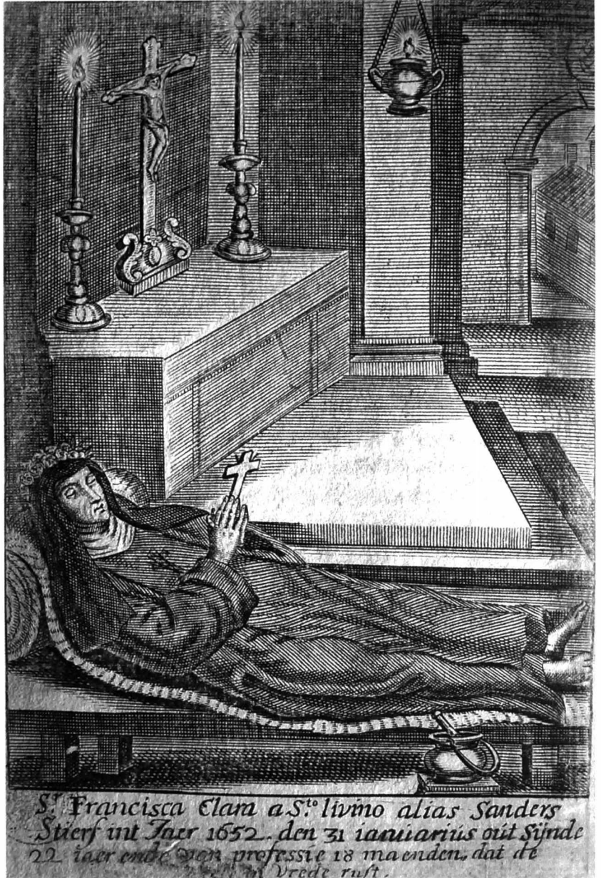
Afb. 5: Het opgebaarde lijk van de gestigmatiseerde.

Vermelden we ook dat de doek van Veronica, “waer mede sij oock uytgeschildert staet, haer ‘merck-teecken’” was. (15) Wellicht bestond er een schilderij waarop Françoise met de doek afgebeeld staat. Een gravure in Cauwes boek is daarvan wellicht een verkleinde kopie (zie afbeelding). Dit “merck-teecken” verklaart ook waarom de engel op de devotieprent Veronica’s doek in de hand houdt. Ook op de gegraveerde titelbladzijde van Cauwes boek komen de vijf wonden op het wapenschild voor. Dit was trouwens niet het enige schilderij van deze ‘gestigmatiseerde’ en ‘heilige’ zuster.