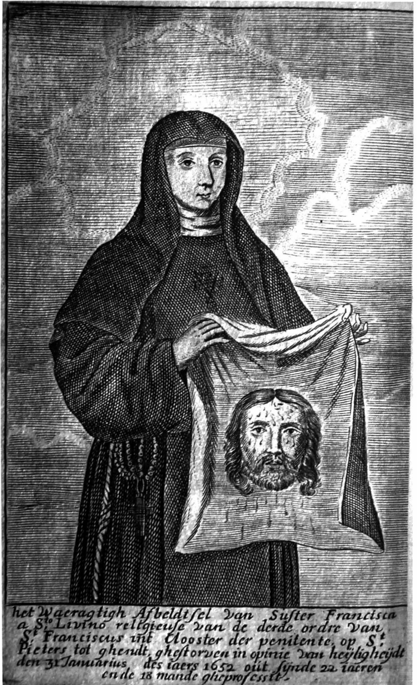
Afb. 4: De zuster met het doek van Veronica.