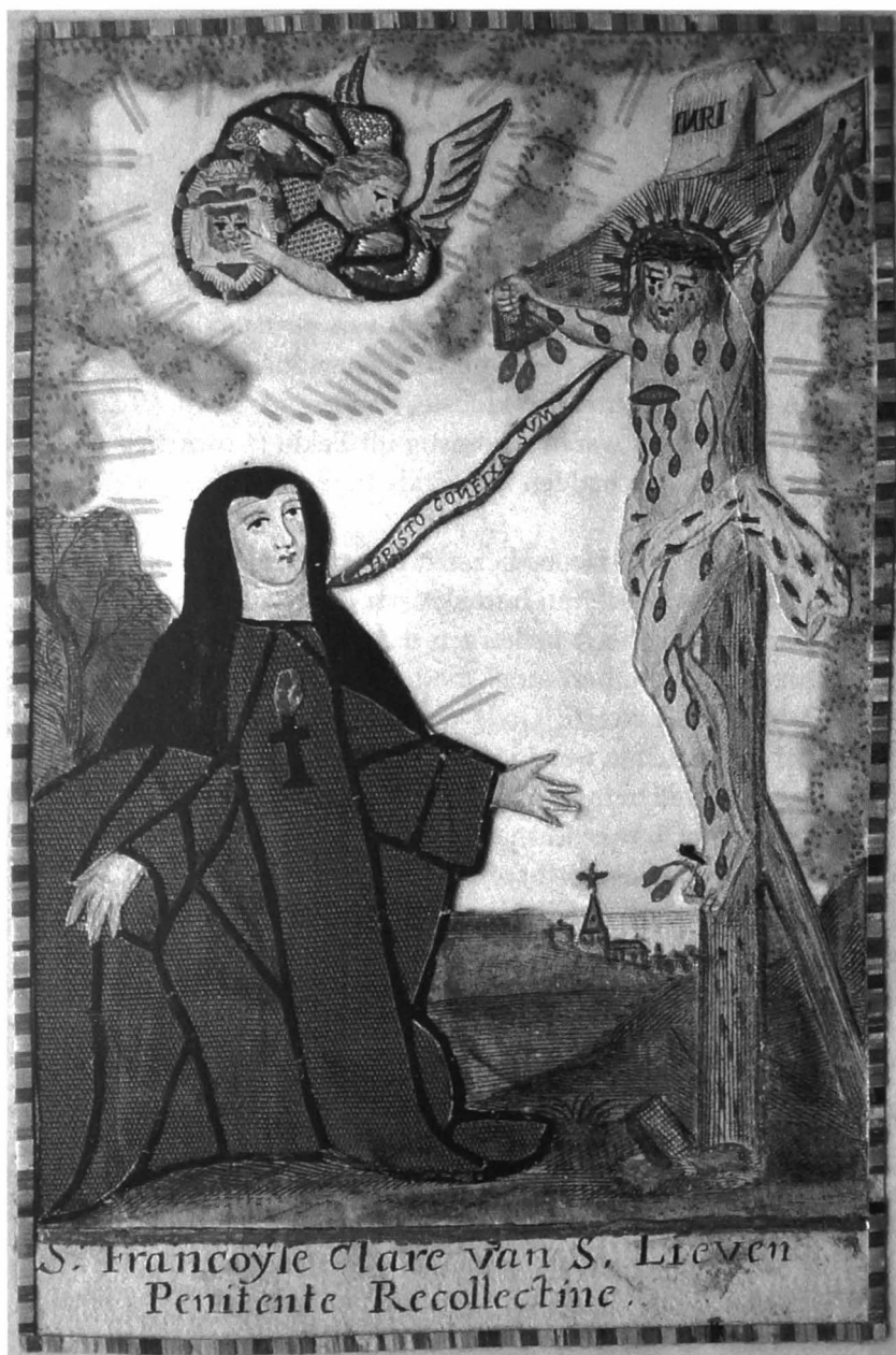
Afb. 1: De beklede prent op perkament.

van zuster Françoise zweeft een eveneens met stof en kleur gehoopte engel, die in de linkerhand een afbeelding van het doek van de H. Veronica vasthoudt, waarnaar hij met de andere hand wijst. De prent is afgeboord met een fijn randje veelkleurig strowerk. Wegens de bruine pij is ze zeker na 1649 te dateren. Dit blijkbaar uiterst zeldzaam devotieprentje kadert in een poging van de penitenten van de Nederkouter om een verering op gang te brengen, die herinnert aan die welke in het met hen verwante klooster bij St.-Jacobs bestond.