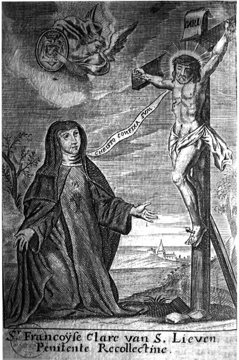
Afb. 2: De gravure die als model heeft gediend.