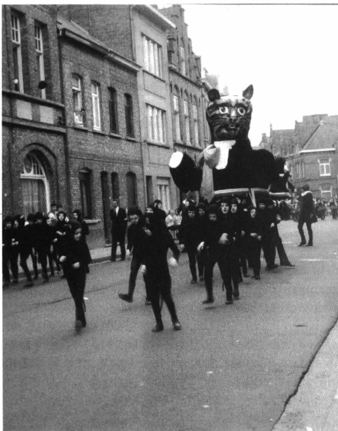
Afb. 10. Reuzenkat Cieper in de kattenstoet van 1985.