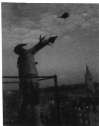
Afb. 2. Het kattenwerpen door de nar te Ieper.