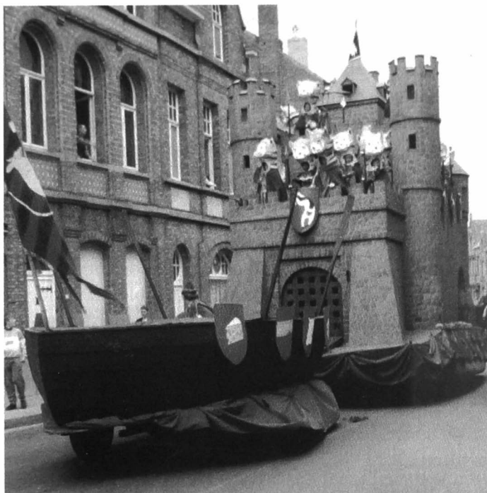
Afb. 9. De wagen met de kattenburcht in de kattenstoet van 1985.

naar Ieper lokte, werd in 1955 naar de tweede plaats geduwd door de Kattenstoet, die lange tijd eenzaam aan de top bleef. De stad heeft daarom veel te danken aan de stoet. Ze heeft Ieper, na de twee wereldoorlogen, weer bekend gemaakt in België en het saamhorigheidsgevoel van de bevolking versterkt. Op dit moment echter kent het frontoerisme een heropleving terwijl de Kattenstoet sinds de jaren negentig nog slechts om de drie jaar plaatsvindt. Dit wil echter niet zeggen dat de stoet geen volk meer trekt, integendeel. Nog elke keer stromen de straten van Ieper vol met stadsbewoners en toeristen die komen kijken naar het spektakel.