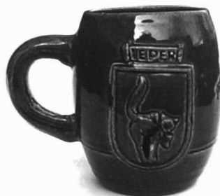
Afb. 4. Gelegenheidsbierpot bij de kattenstoet.