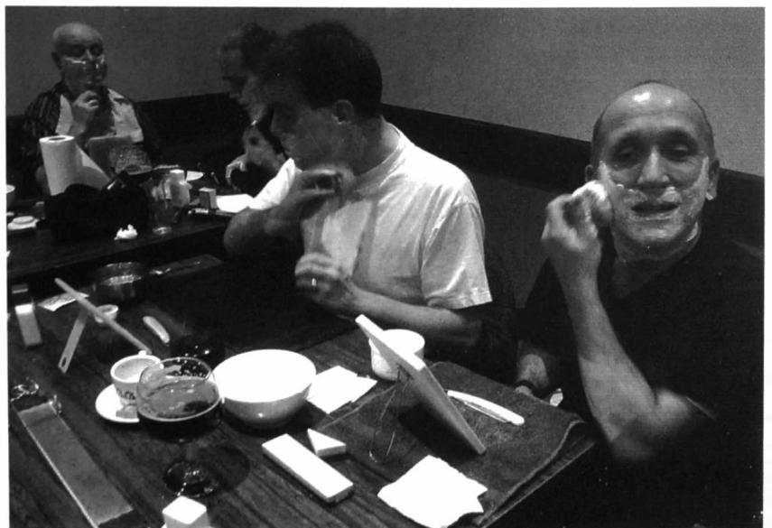
De cursus klassiek scheren was een succes.

Naast deze intrigerende uithangtekens, de antieke kappersstoelen en typische producten om het haar te behandelen, zijn ook de attributen te zien die nodig zijn bij het klassiek scheren met het scheermes. Het scheren was een echt ritueel, waarbij de barbier het scheren voor zijn klanten zo comfortabel mogelijk maakte. Het scheermes werd opgewarmd op een handriem en gewet op een aanzetsteen. Vóór het