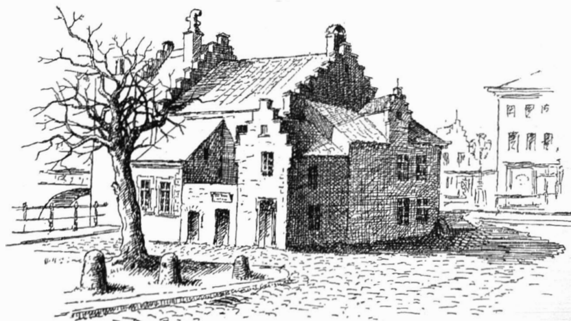
Afb. 2. Geboortehuis van J.B.L. Maes, overgenomen uit F. de Potter, Gent van den oudsten tijd tot heden , Gent, 1893, deel 7, p. 197.

Vanaf dat ogenblik zal hij frequent en met succes deelnemen aan salons en wedstrijden die specifiek ingericht worden om de kunstbeoefening te stimuleren en kunstenaars de kans te bieden hun werken te tonen en te koop aan te bieden. In 1816 ontvangt Maes een eerste