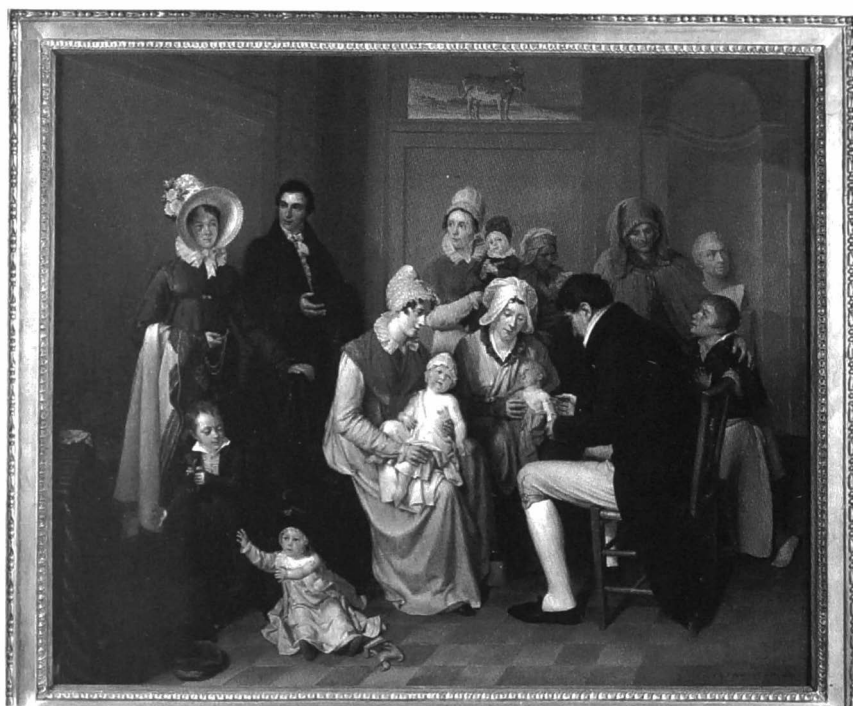
Afb. 6. De koepokinenting, J.B.L. Maes, Gent, 1819, olieverf op doek, Bijlokemuseum/STAM, inv.nr. A2000-1.

Salon de Gand' van 1823 aangeeft als hij het heeft over de verdiensten van J.B.L. Maes: "il mérita le premier prix du tableau de genre, représentant 'Une salle de vaccine'. Ce tableau appartient actuellement à M. Joosting, à Amsterdam". (12) Het interessante werk verbleef vermoedelijk altijd in Nederlandse privé-collecties.