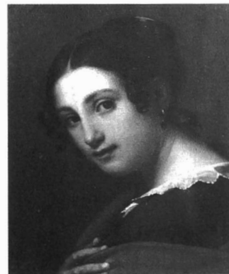
Afb. 5. Portret van Jonge Italiaanse, J.B.L. Maes, Rome 1828, olieverf op doek, Bijlokemuseum/STAM, inv.nr. A65-2-29.