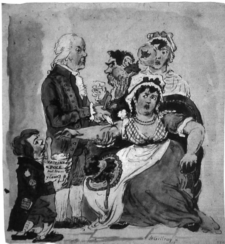
Afb. 8. Vaccinatie met koepokstof, 1796-1825, spotprent van Gillray James, Museum Boerhaave, Leiden, inv.nr. P00550.