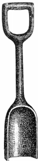
Afb. 3: uit Nouveau Larousse illustré

gedroogd. Een paar uren voor gebruik worden ze in een vochtige vod gewikkeld. (4) Ze kunnen ook een paar dagen in het zout bewaard worden.