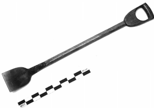
Afb. 1: industrieel gemaakte aasspade MOT V 89.0232 L=102cm B=13cm G=1,550kg. Opschrift: Polet Borsbeke

De zeepier ( Arenicola marina ) leeft voornamelijk in het zand van slijkerige stranden - dat van Heist was vroeger beroemd om het aantal vondsten... Op die stranden tref je soms grote aantallen hoopjes zand aan met 15 cm verder een trechtervormig putje. Gaatje en hoopje zijn de twee uiteinden van een verticale U-vormige buis, woonplaats van de zeepier. Via de trechter zuigt de worm zand aan, dat water en sedimenten bevat. Na vertering van de voedingsstoffen, wordt het zand weggeworpen en vormt het rolronde hoopjes aan het andere uiteinde van de buis. (2)