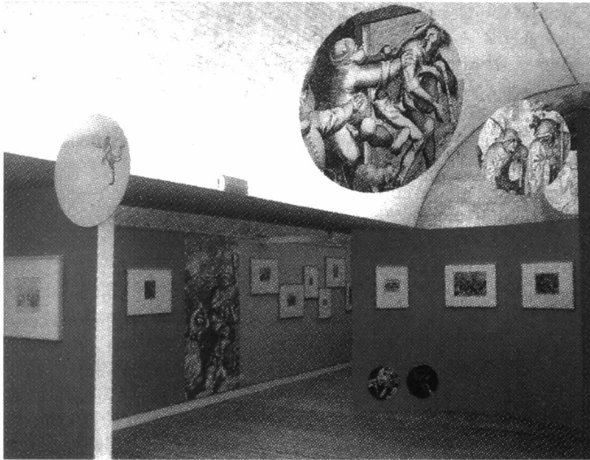
Musée du Dessin et de l'Estampe Originale te Gravelines, Noord-Frankrijk

In het land van Carnaval spelen kleuren een ondersteunende rol in het feestgedruis. De scenografie van de expositie neemt dit gegeven als uitgangspunt. Het kleurenspeel geeft de tentoongestelde tweedimensionale gravures een driedimensionale kracht. Vijf thema's worden - in chronologische volgorde volgens de Carnavalkalender en overeenstemmend met het tijdsverloop van de gebeurtenissen - op het schilderij van Pieter Bruegel, 'Het gevecht tussen Carnaval en Vasten', 1559 (Wenen, Kunsthistorisches Museum) aangesneden: de geboorte van Carnaval "naître"; tegenover het geboren worden wordt meteen de vernietigende kracht van het sterven geplaatst: de moraliserende kracht van de gravures met Carnavalthema "mour-rire"; het thema gevecht "ceux qui luttent" is onlosmakelijk verbonden met de twee vorige thema's; de dood van Carnaval "adiou paure carnobal" en tenslotte "Memento Mori" of Carnaval stelt de kunst van het vergeten centraal. De evolutie van de Carnavaltraditie en de rituele Carnavalfeesten (vb. dierenafslachting Venetiaans Carnaval; gemaskerd bal) door de tijd heen worden belicht. De expositie toont hoe bepaalde festiviteiten worden gehumaniseerd en/of gelaïciseerd (vb. Koppermaandag). Het voormelde kunstwerk van Pieter Bruegel is de centrale as waarrond alle tentoonstellingsonderwerpen lijken te wettelen. Op de tentoonstelling is een kopie van dit werk aanwezig.