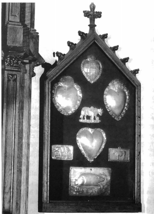
Afb. 7: Lijst met zilveren ex-voto's.