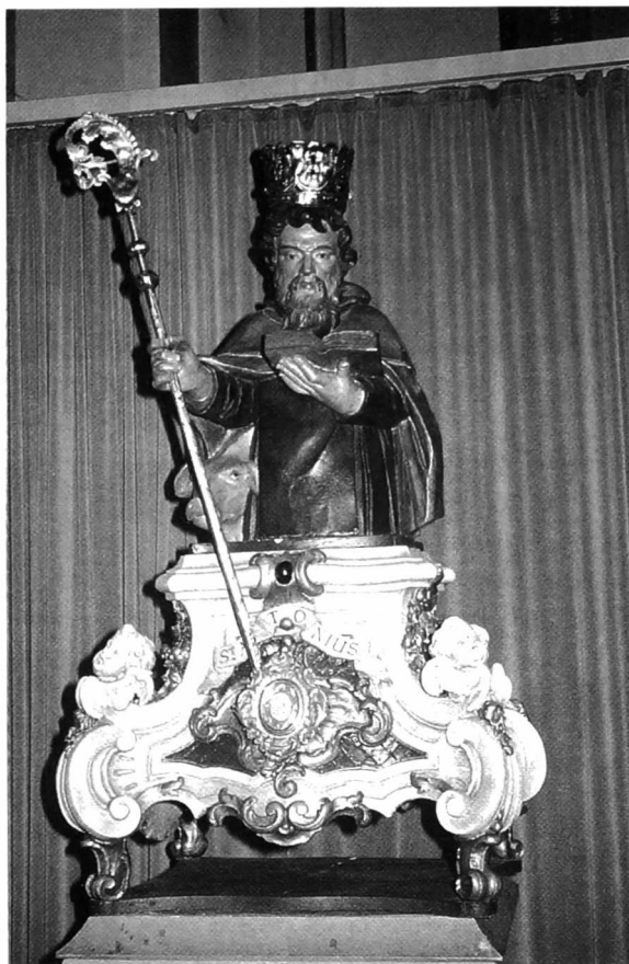
Afb 2: Het Sint-Antoniusborstbeeld op een sarcofaag in Lodewijk XIV-stijl.

Het St.-Antoniusborstbeeld (1678) staat op een sarcofaag in Lodewijk XVI-stijl (ca 1750). Op de hoeken prijken twee engelkopjes. Sommige delen van het hout zijn wit geschilderd, andere zijn verguld, vooral de plaats waarin het osculatorium gevat zit. In een tekstband staat de naam "St.-Antonius". (afb. 2)