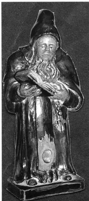
Afb. 12: Het Antoniusbeeldje met de tap in zijn gat in vooraanzicht.