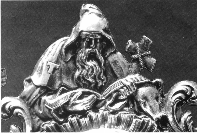
Afb. 9: Een zilveren reliekhouders