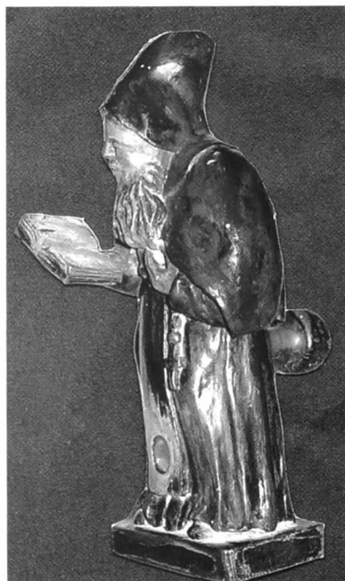
Afb. 11: Het Antoniusbeeldje met de tap in zijn gat in profiel.