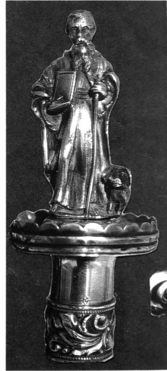
Afb. 10: Een zilveren ceremoniestaf