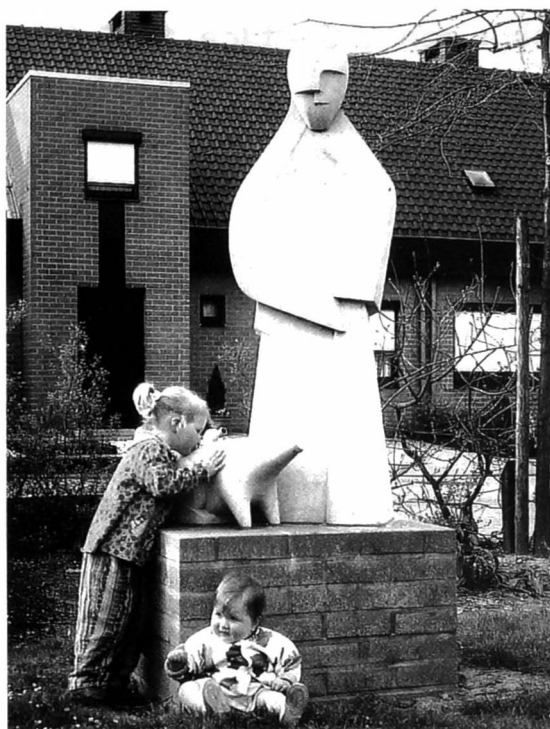
Afb. 15: Een moderne Antonius met zijn varkentje

Op het pleintje van de St.-Antoniuswijk, opgericht omstreeks 1990, staat een moderne Antonius met zijn varkentje waarvan wij graag het ontstaan willen vernemen. (afb. 15)