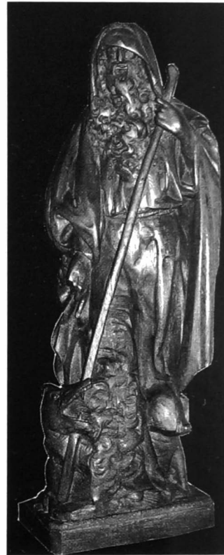
Afb. 14: Het Sint-Antoniusbeeld met de draak.

“Rond de jaren 1950 gaf men een heel andere wending aan de vereering van Sint-Antonius, vooral ter gelegenheid van de winterommingang. Het sportcomité, daartoe aangemoedigd door de nieuwe geestelijkheid én door enkele cafébazen, vatte het feest anders op. Er moest opnieuw leven in de brouwerij komen. De bestuursleden van “Yvegem sportief” en de leden van de kerkraad droegen op die winterommingang een zwarte bolhoed - vandaar hun naam “Bol-hoedheren”. Men bracht de geschenken in de herberg “De Halve Maan” bij Aaron Duprez. Men richtte een kleine stoet in met de geestelijkheid