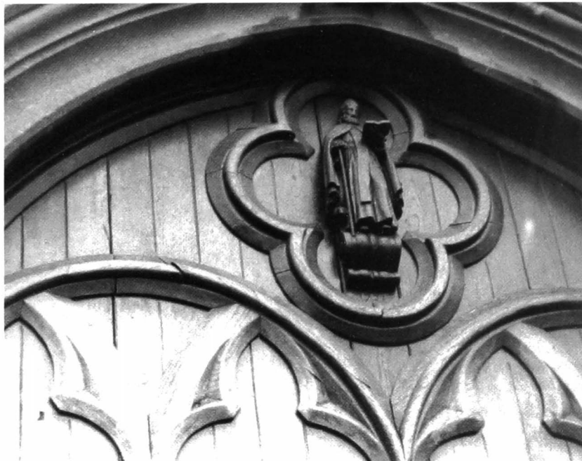
Afb. 8: Een houten Sint-Antoniussbeeld in een vierpas.

Ex-voto ( donum ) betekent, letterlijk vertaald: “gift krachtens een belofte”. Het ex-voto bestaat uit een afbeelding met betrekking tot de gevraagde gunst, die werd opgehangen in de onmiddellijke omgeving van het genadebeeld, waaraan men een bezoek brengt. Het ex-voto is niet het hulpstuk zelf, zoals krukken en beenstukken, maar gewoonlijk de afbeelding ervan. Deze werden dan vervaardigd in was of gestampt in zilverplaat. Niet alleen genezingen voor eigen ziekten werden aldus bevestigd, maar ook die van voor de mens belangrijke dieren als paarden, runderen, varkens. Met een menselijk vlammend hart “laaiend van liefde” wordt de dankbaarheid betoond aan de aangeroepen heilige. Enkele kloosters o.a. de zusters Colettien te Mechelen betrokken uit het vervaardigen van deze vormen een bescheiden inkomen. Deze ex-voto’s te Ingoogem dagtekenen uit het midden van de 19de eeuw.