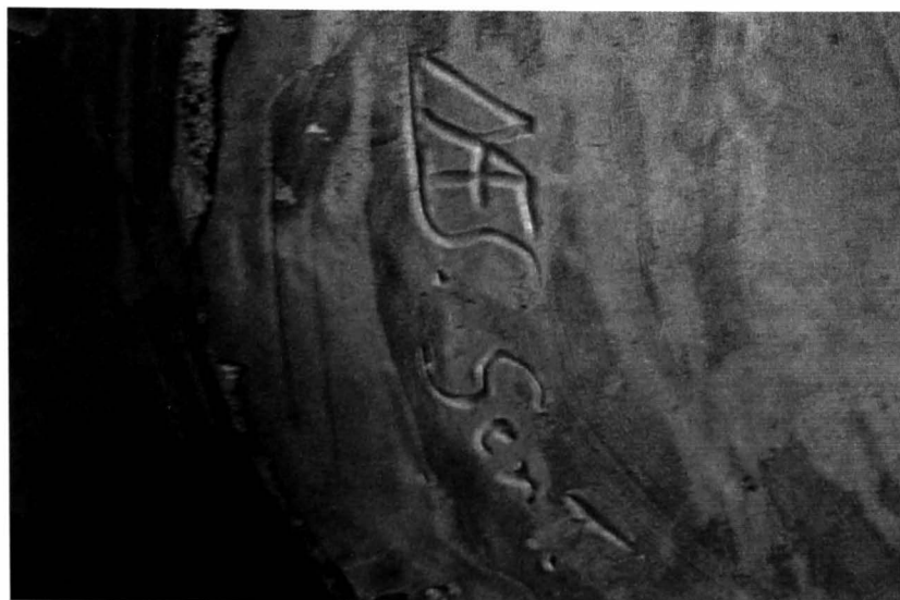
Afb. 10 en 11: De pot van Beeckman met het wapenschild van de juristen en een detail van de signatuur van het atelier Maes.