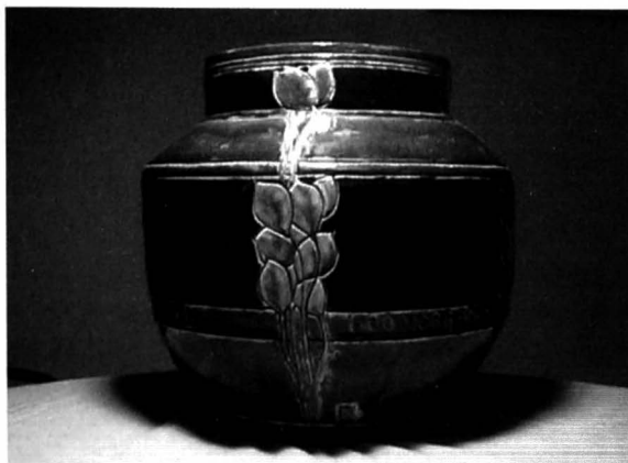
Afb. 7 en 8: de pot van Verbanck (1911) met het wapen van de Sint-Jorispilde en de signaturen van de ontwerper en de uitvoerder.