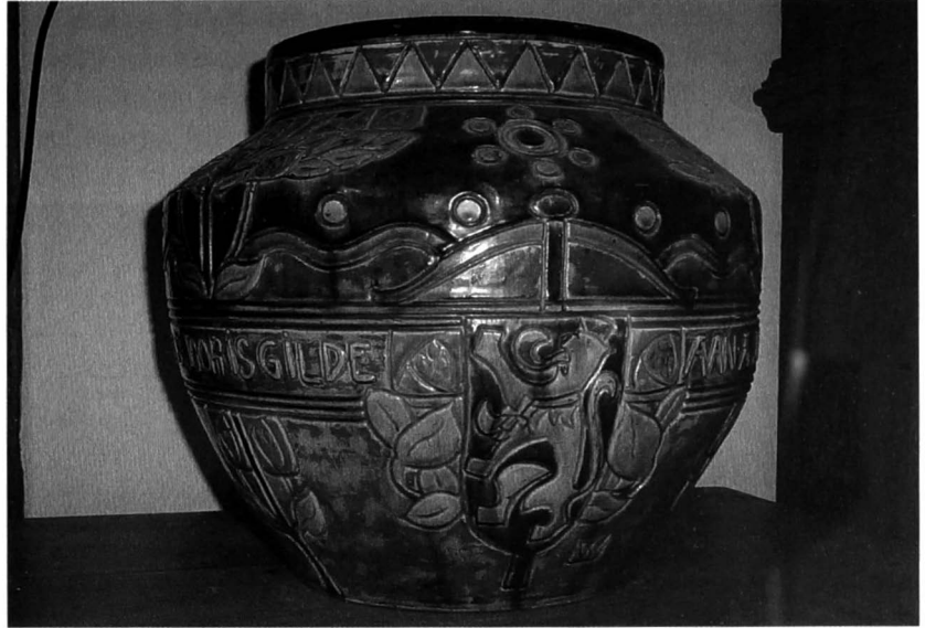
Afb. 2: De cache-pot van architect Janssens (1909) met het wapen van de stad Gent, links ervan de signatuur van de pottenbakker en rechts van de ontwerper.