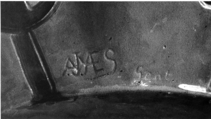
Afb. 5: detail signaturen op de zijkant van de pot Mees (1910).

Op het schouderstuk prijken de bloementrossen in volle weelde op een blauwe achtergrond. Elke tros is van de andere gescheiden door een gestileerd blauw bloemenmotief. Het schouderstuk is van de rechtopstaande boord gescheiden door een smalle rode band. De boord heeft opeenvolgend een blauwe rand en een band van driehoeken afwisselend rood en blauw. Rechts van het stadswapen staat de signatuur 'AJMaes Gent' en op de bodem zijn twee vogels ingeprint. Het gaat duidelijk om een stuk uit het atelier van de broers August en Jules Maes die op 7 november 1909 het bedrijf van hun vader overnamen.