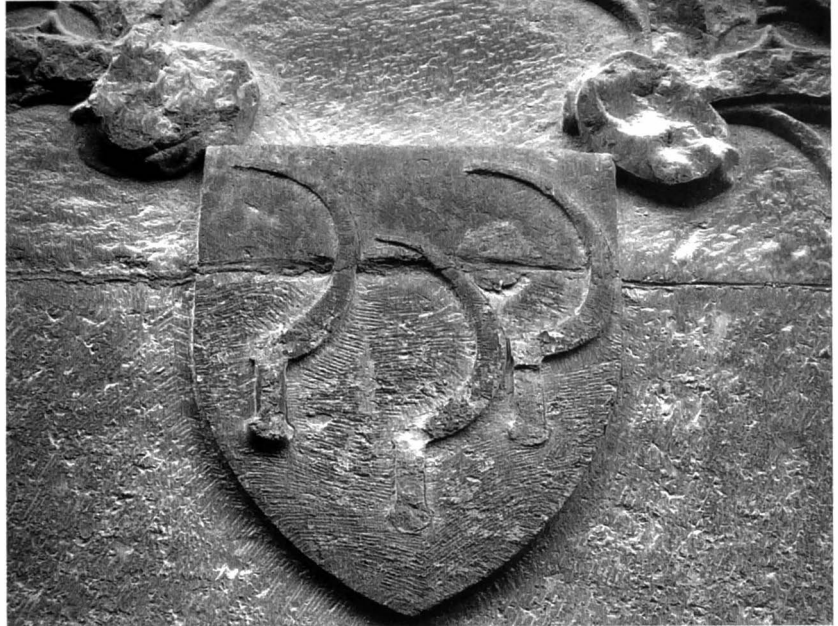
Afb. 3: Sikkels boven de toegangsdeur van de Kleine Sikkel aan de Nederpolder. Ze werden er vermoedelijk aangebracht bij de restauratie in 1913.

Dat laatste gebeurde volgens een anonieme, vermoedelijk Gentse kroniekschrijver (23) als volgt: Ende te Ghendt was een rewaert (24) ghemact, hyet (hij heette) Rasin Mulaert. Ende hy dede een ghebot doen, zo wie eenen ruddere vynghe zoude hebben twee ponden grooten; ende wie eenen poortere of sciltknecht sloughe of vynghe, hy zoude hebben een pondt grooten. Ende daer liepen vele uut omme wasdom te crighene (om buit in te halen), maer zy verghaten zom (soms) weder te keerne. Zy liepen t Aertvelde (Ertvelde) ende zy hilden daer eenen poortere ende zynen cnappe dewelke van twiste uter stede was ende hyet (hij heette) Symoen Rym, al de Rym's die hoofden an (Symoen was het familiehoofd). Ende hy ne was der stede noynt contraye, nochtans zy onthoofdene, ende zynen cnappe (schildknaap) ooc. (25)