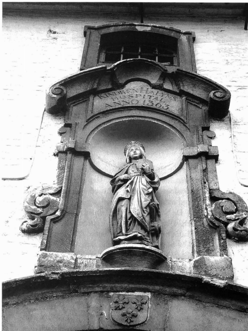
Afb. 1: Beeld boven het barokke ingangspoortje aan de Kraanlei van de H. Catherina, patrones van het Kindren Halyns Hospital 1363 , zoals het opschrift luidt. De stichtingsakte werd in dat jaar opgemaakt, maar het generaal akkoord daartoe was al in 1362, onder leiding van Jan van der Zickelen tot stand gekomen en pas in 1365 toen de goedkeuring van de stichting door de bisschop van Doornik arriveerde, was alles in orde. De wapenschildjes op de poortomlijsting onder het beeld (hier niet zichtbaar) zijn van de families van Pottelsberghe-van Steelandt, Immerseel en Sersanders, die in de 16de eeuw een belangrijke rol speelden bij de herinrichting van het godshuis.

nog de Borluuts tegenover de clan van Sint-Baafs had geplaatst. Zie BLOCKMANS, W. Een Middeleeuwse Vendetta. Gent 1300, Houten 1990, pp.1-160.