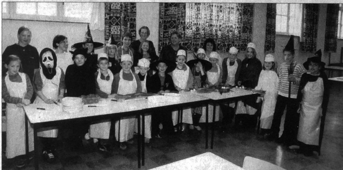
Vorige week donderdag organiseerde Gezinsbond Sint-Kruis een Halloweenkooknamiddag voor kinderen in de feestzaal van parochiecentrum 't Couvent in Male. Heel wat spoken, geesten en heksen kwamen in potten en pannen roeren en bereidden onder de deskundige leiding van enkele moeders een lekker etentje. Tijdens die leuke namiddag maakten de griezels ook even tijd voor een foto...

* Heksenbrouwsel en addergebroed op het menu ( Brugs handelsblad , 8.11.2002)