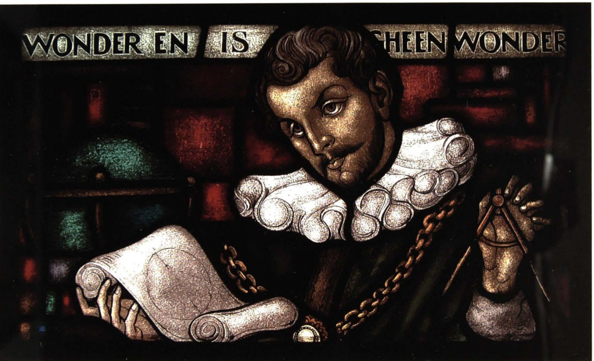
De natuurkunde verbeeld door Simon Stevin (1548-1620).

aardcloot of werldebol naar zijn belangrijk werk over de aardbeschrijving. Bovenaan lezen we zijn leuze Wonder en is gheen wonder . Daarmee bedoelde hij dat ook de moeilijkste vraagstukken een heldere oplossing kunnen krijgen. Dit motto wordt vermeld op de titelpagina van zijn De weeghdaet uit 1586.