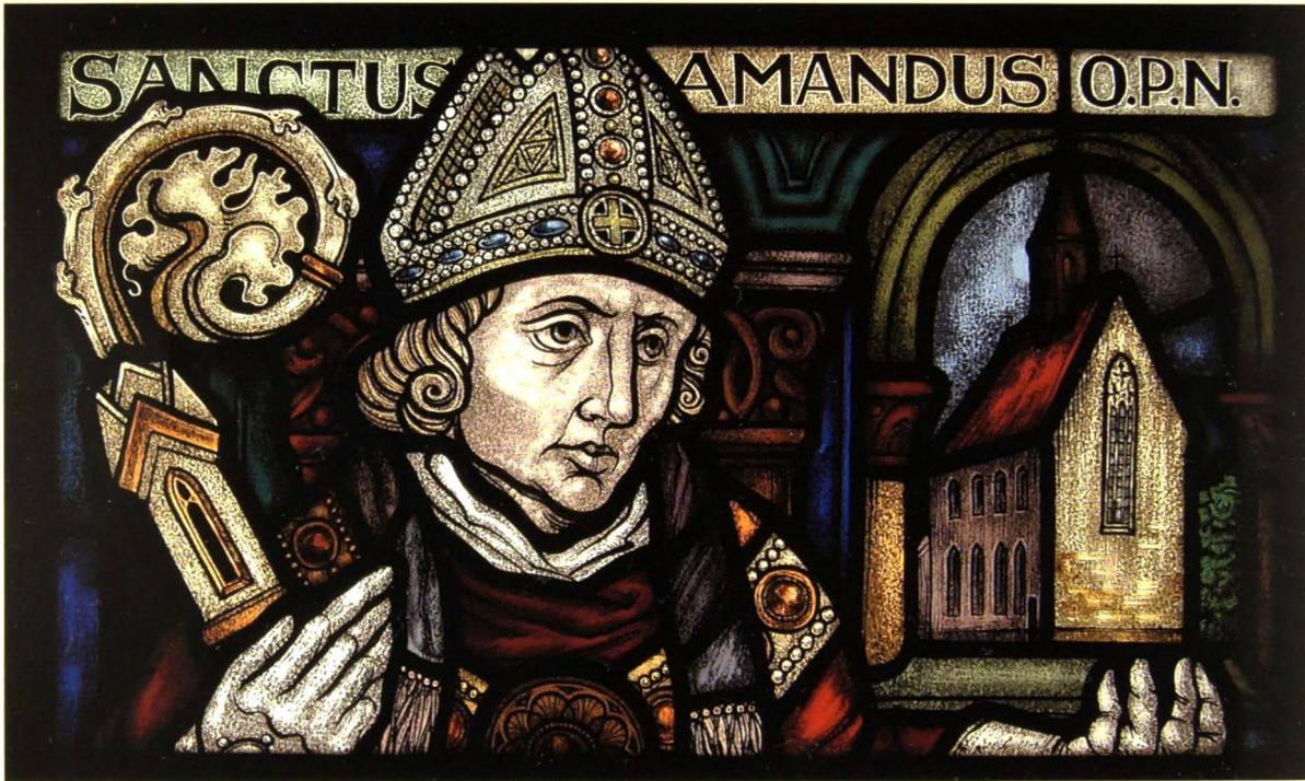
De H. Amandus patroon van de nering van de kruideniers en de apothekers.

zowel op fol. 71 (een O.L.Vrouw, Sint-Amandus en de H. Dorothea met bloemen en zwaard, 1788) (18) als op fol. 73, een illustratie van J. Beerblock met Sint-Amandus, O.L.Vrouw met Kind en de personificatie van de flora gesymboliseerd door een vrouwenfiguur (19) . De tekst op het glasraam luidt: Sanctus Amandus O.(ra) P.(ro) N.(obis) (Heilige Amandus bid voor ons).