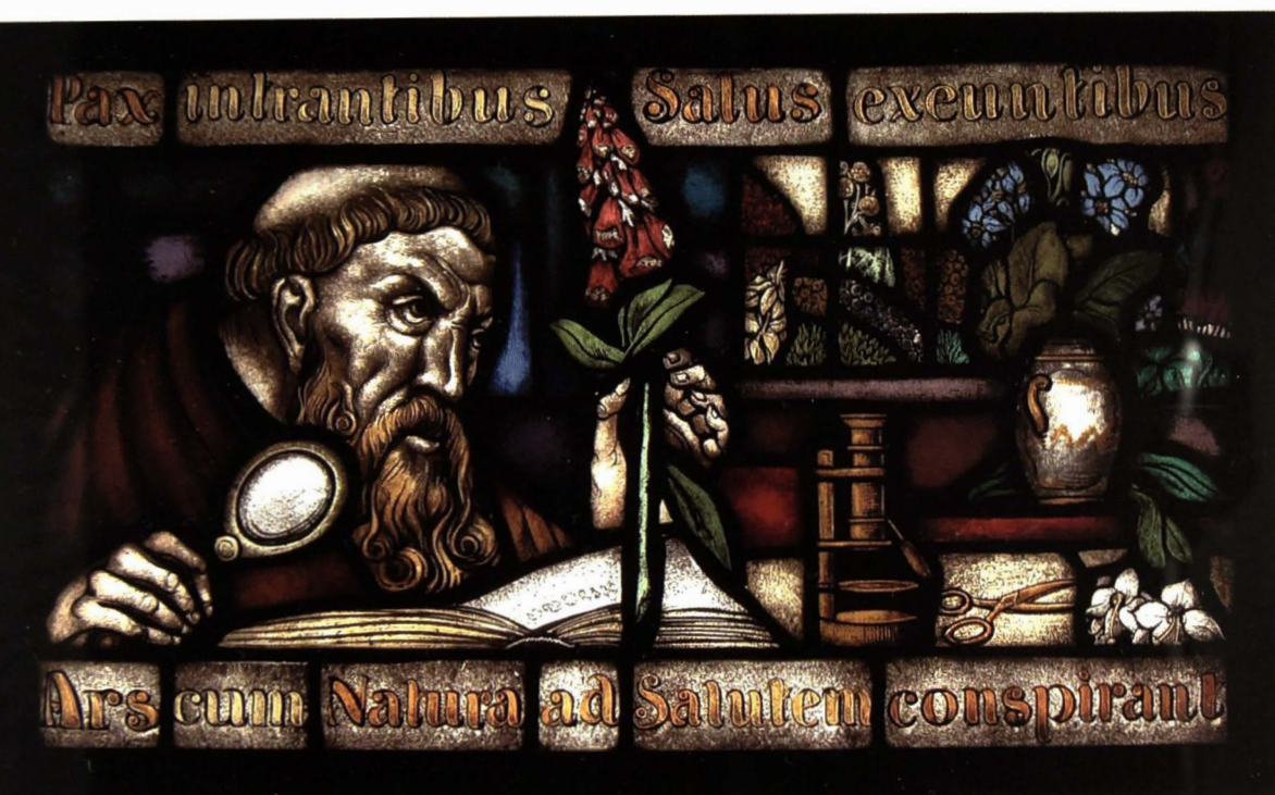
De farmacognosie verbeeld door een aandachtige monnik.

12) Dit register wordt bewaard in het Stadsarchief van Brugge. A. Vandewalle, Beknopte inventaris van het Stadsarchief van Brugge. Deel I , Oud Archief, Brugge, 1979, p. 141 en bespreking in Catalogus Sint-Janshospitaal Brugge 1188-1976 , Brugge, 1976, deel II, p. 380.