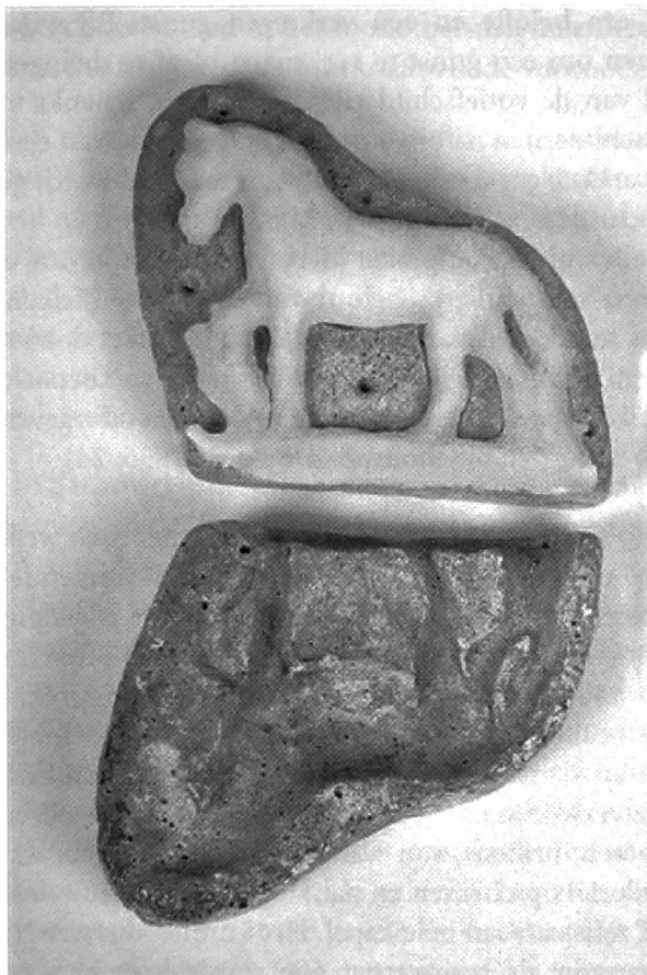
Wassen ex-voto met moule.

Ex-voto's kunnen votieve gaven of offergaven zijn. Ex-voto's als votieve gaven passen in onze christelijke cultuur. Het zijn votiefgeschenken waarmee men een hogere macht dankt voor een verkregen gunst. De verschillende stadia zijn hierbij: iemand ondergaat een beproeving. Hij of iemand anders bidt om hulp tot God of een tussenpersoon (Maria, heilige), doet tegelijkertijd een belofte (op bedevaart gaan bijvoorbeeld) en vervult (na verkrijging van de gevraagde gunst) deze belofte via een, meestal zichtbare, materiële daad of gift.