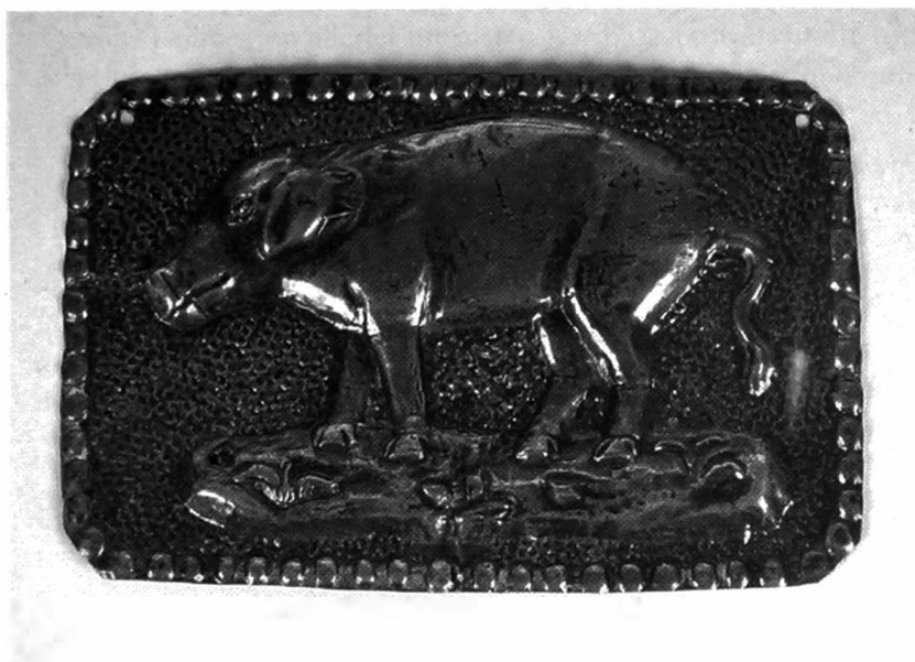
Metalen ex-voto.

nele voorstellingen mee te maken. De overeenkomst met het lichaamsdeel of met het dier was voor de offeraar immers zeer belangrijk. Sommigen wensten met deze gave ook hun ziekte op een symbolische manier te offeren en ervan af te raken. Er is zelfs een bedevaartsplaats in Oost-Vlaanderen waar een kapelverantwoordelijke tot voor kort de offerandebeeldjes in een metalen schaal aan het altaar opbrandde. Dergelijke gewoonten gaan terug op magische rituelen van de Keltische cultuur. Restanten ervan vinden we ook bij het afbinden van koorts: een stukje textiel dat in aanraking met de zieke is geweest, wordt daarbij gebonden aan het traliewerk of aan boomtweigen bij een koortskapel.