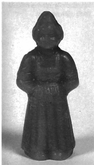
Wassen ex-voto.

menselijke kracht (één God in het monotheïsme, meerdere goden in de polytheïstische religies, de natuurkrachten, de voorouders,...).