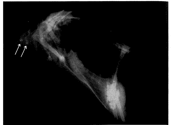
Fig. 1. Eend: Latero-laterale opname van de thorax en het abdomen. In de oesofagus zijn er craniaal van de thoraxingang enkele grotere partikels met verhoogde opaciteit zichtbaar. Dit wijst op overvulling van de oesofagus. De thoracale en abdominale luchtzakken lijken tympanisch. De inhoud van de spiermaag (ventriculus) is niet goed te beoordelen op dit beeld.

Na het nemen van een bloedstaal op heparine uit de V. basilica, werd chelatietherapie begonnen met Ca 2 NaEDTA (35 mg/kg), tweemaal daags intraveneus, in afwachting van de resultaten van het bloed-