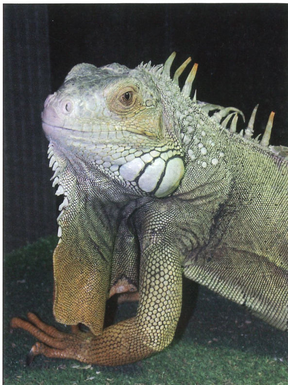
Fig 3. De groene leguaan ( Iguana iguana ) wordt vaak als huisdier gehouden. Ook voor dit dier is er een meldingsplicht op het gemeentebestuur.

bescherming van inheemse soorten (bijvoorbeeld de Habitatrictlijn) zijn bepaalde inheemse soorten die zijn opgenomen in C.I.T.E.S.-bijlagen II en III, opgenomen in bijlage A. Ook sommige soorten die helemaal niet in de C.I.T.E.S.-bijlagen zijn opgenomen, staan wel in de EU-regelgeving voor de handel in wilde dier - en plantensoorten.