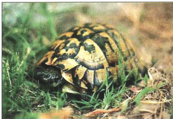
Fig. 2. De bekende Griekse landschildpad ( Testudo hermanni ) behoort tot C.I.T.E.S.-bijlage II en Europese bijlage A en moet dus nu ook geïdentificeerd worden met een microchip.