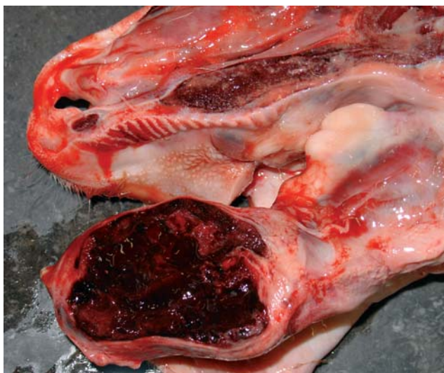
Figuur 2. De aneurismatische beencyste was volledig gevuld met gestold bloed en bevatte enkele beenschotten.