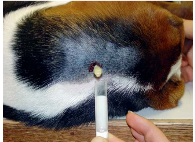
Figuur 4. Cervicale punctie van cerebrospinaal vocht

elke patiënt met aanvallen. Een nadeel ten opzichte van de humane geneeskunde is dat men als dierenarts moet voortgaan op het verhaal van de eigenaar en dat er belangrijke details op die manier kunnen verloren gaan. Bovendien kunnen ook aanvallen worden gemist. In