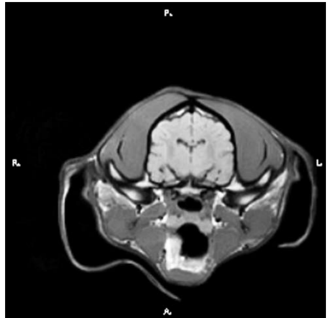
Figuur 2. Normale T1-gewogen transversale MRI van de hersenen van de hond (CT-MR Unit, Vakgroep Medische Beeldvorming van de Huisdieren en Orthopedie Kleine Huisdieren, UGent)