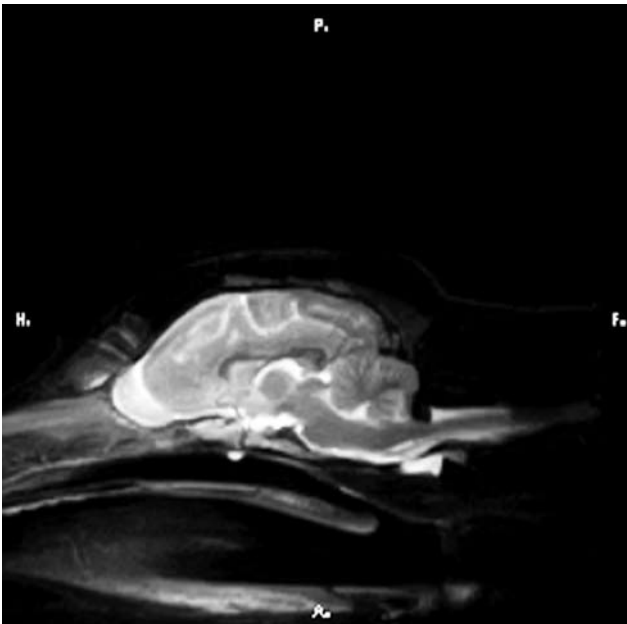
Figuur 1. Normale T2-gewogen sagittale MRI van de hersenen van de hond (CT-MR Unit, Vakgroep Medische Beeldvorming van de Huisdieren en Orthopedie Kleine Huisdieren, UGent)