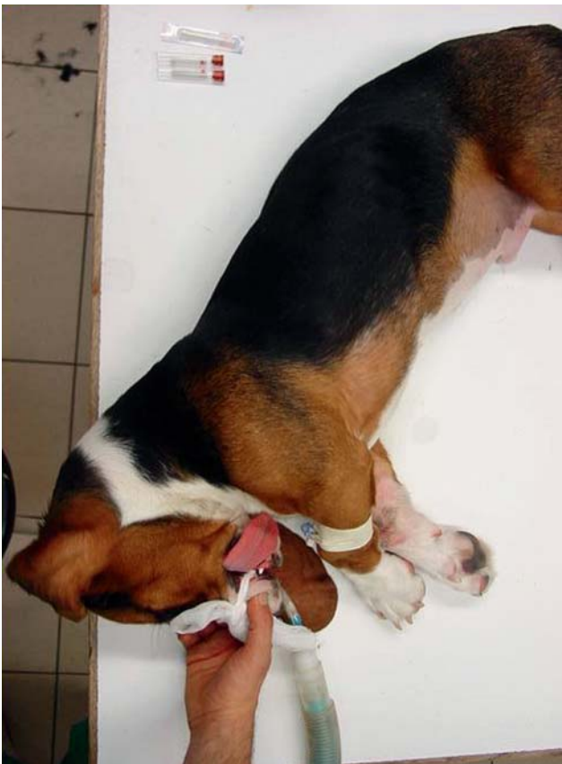
Figuur 3. Positie van de hond voor een cervicale punctie van cerebrospinaal vocht

elke patiënt met aanvallen. Een nadeel ten opzichte van de humane geneeskunde is dat men als dierenarts moet voortgaan op het verhaal van de eigenaar en dat er belangrijke details op die manier kunnen verloren gaan. Bovendien kunnen ook aanvallen worden gemist. In