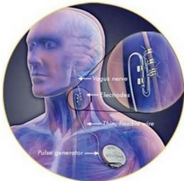
Figuur 5. Schematische weergave van de implantatie van een vagale zenuwstimulator bij de mens

halfwaardetijd dan gabapentine bij de mens en bovendien zou het nog effectiever werken (Dewey et al. , 2009). Slechts één studie bij de hond werd tot op heden beschreven, waarbij elf honden pregabaline kregen bovenop de standaardmedicatie gedurende drie maanden. Pregabaline gaf een vermindering van de aanvallen bij negen honden (Dewey et al. , 2009). De dosis die wordt gebruikt bij de hond is 3-4 mg/kg 3x/dag. Bij de meeste honden uit de studie werden vrij ernstige sedatie en ataxie opgemerkt als neveneffecten.