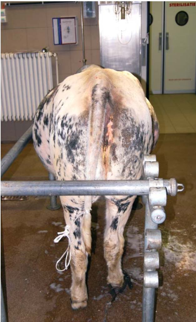
Figuur 1. ‘Pappelbuik’ van casus 1: uitzetting van het linker dorsale, linker ventrale en rechter ventrale abdominale kwadrant.

prevalentie van 40% bij de dieren aangeboden voor diagnostische of therapeutische laparotomie (Singh et al. , 1980b). De reden voor de hogere prevalentie bij buffels zou een lager collageengehalte van het diafragma en een hogere intra-abdominale en lagere pleurale druk zijn dan bij westerse runderen (Singh et al. , 2006). Ook leefomstandigheden waarin de dieren extensief gehouden worden en het baden of het zoeken van drinkwater in diepe rivierbeddingen met steile oevers, zouden bijdragen tot meer trauma van het diafragma dan bij conventioneel gehouden dieren (Misk en Semieka, 2001).