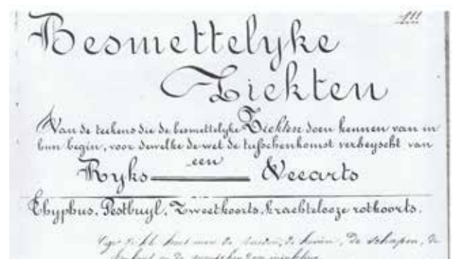
Figuur 2. Aanhef van het tekstdeel over de ziekten waarmee de auteur en zijn ongediplomeerde collega's zich niet mochten bemoeien.

Voor een beschrijving van de inhoud van het 125 pagina’s tellende ‘boek’ wordt verwezen naar Bouc- kaert (2005). Om een voorbeeld te geven van wat er over sommige ziekten bekend was in het hier beschre- ven lekenmilieu in de 19 de eeuw, volgt hieronder een fragment over de ziekte van Carré, alias de honden- plaag of jonge hondenziekte uit het Bouckaert-hand- schrift, anno 1880. Voordat de vaccinatie vrijwel alge- meen werd toegepast, was deze zeer besmettelijke vi- rale aandoening, verwant met de menselijke mazelen, een te duchten ziekte, nauwelijks te behandelen. Het was een gevreesde plaag, destijds alom bekend bij