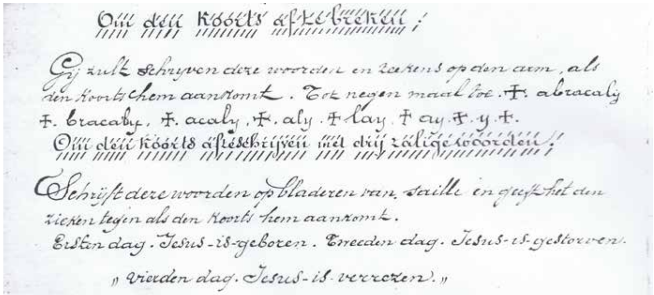
Figuur 3. Bezweringsformule: letterlijk abra kadabra. Saille betekent salie.

fokkers en handelaars als dé hondenziekte. Het citaat wordt woordelijk weergegeven in cursief met hier en daar een verduidelijking tussen haakjes. Enkele zinnen werden gesplitst, een enkele verplaatst.