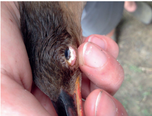
Figuur 1. Kazige, nodulaire letsels ter hoogte van de palpebrale conjunctiva van het linkeroog.

De massa ter hoogte van de conjunctiva werd enkele maanden vóór presentatie reeds opgemerkt door de eigenaar en werd toen succesvol behandeld met een lokale toediening van chlooramfenicol (Chlooramfenicol 1% + vitamine A oogzalf, Virbac, Barneveld, Nederland) en oxytetracycline oogzalf (Terramycine + polymyxine B oogzalf, Pfizer, Brussel, België). Een maand vóór het dier op de Faculteit Diergeneeskunde (UGent) aangeboden werd, was de massa teruggekeerd en vertoonde ze een progressieve groei. Behandeling met enrofloxacin (Baytril 10%, Bayer Animal Health, Diegem, België) per oraal gedurende