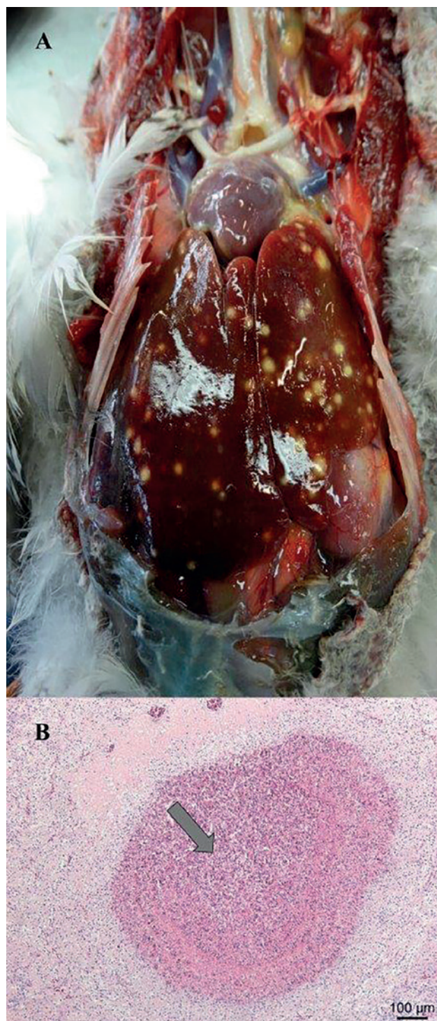
Figuur 2A. Multifocale, granulomateuze letsels in de lever. B. Histologische afbeelding (HE-kleuring) van de lever gekarakteriseerd door de aanwezigheid van een granuloom (pijl) met accumulatie van fibrinonecrotisch materiaal met rondom gedegenerende heterofielen, macrofagen en lymfocyten.

Na veertien dagen behandeling bleek de conjunctivaalzak echter opnieuw gevuld met een kazige substantie. Onder gasanesthesie (isofluraan + zuurstof) werd vervolgens een biopsie genomen van de massa en van de conjunctiva voor verder histologisch onderzoek. Intraoperatief werd eveneens zoveel mogelijk etter weg gecuretteerd. Het histologisch onderzoek (hematoxyline en eosine (HE)-kleuring) van dit biopsie toonde necrotisch weefsel aan met een uitgesproken infiltratie van heterofielen en lymfocyten. Gramkleuring toonde enkel groepjes staafvormige gramnegatieve bacteriën aan. De periodic acid-schiff (PAS)-kleuring was negatief voor schimmelhyfen. De algemene toestand van het vrouwelijke dier ging achteruit, gekenmerkt door lethargie en milde diarree. Enkele dagen later is het dier gestorven. Bij autopsie bleek de eend cachectisch (LG 595 g). De conjunctiva van het linkeroog was gezwollen en op de mucosa van het ooglid was een kazig/necrotisch beleg aanwezig. De linker infraorbitaal sinus was ook gevuld met die substantie. De dunne darm was gevuld met gas en vertoonde vaatinjecties. Het laatste deel van de dunne darm was sterk hemorragisch en necrotisch. De darmlussen waren onderling verkleefd. De longen waren gestuwd en oedemateus. Er was ook één granuloom aanwezig in de longen. De luchtzakken waren troebel en bevatten fibrineus exsudaat. Op de lever