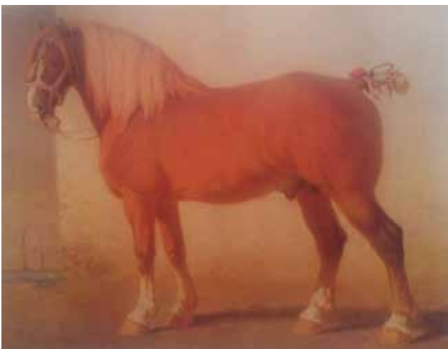
Figuur 5. De kampioenhengst Brillant geboren in 1868 (Haras de Vollezele), die tussen 1878 en 1884 de hoogste internationale prijzen behaalde. Geangliseerd: met nog vrij lange, door sectie van de staartbuigspiertjes horizontaal gedragen en ingewonden staartstomp (Charles Tschaggeny, 1878).

De hierboven geschetste esthetische overweging, sinds mensenheugenis algemeen aanvaard in de trekpaardenwereld, was niet de hoofdreden van het snel ingang vinden van de staartamputatie tijdens de laatste