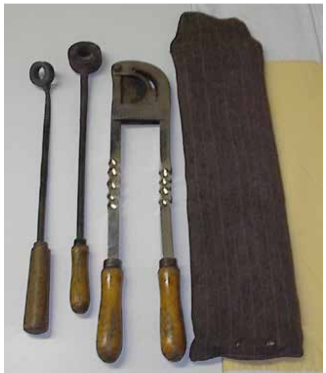
Figuur 8. 'Trousse' met staartcoupeermes en speciale ringvormige brandijzers (Instrumentencollectie Diergeneeskundig Verleden, Merelbeke).