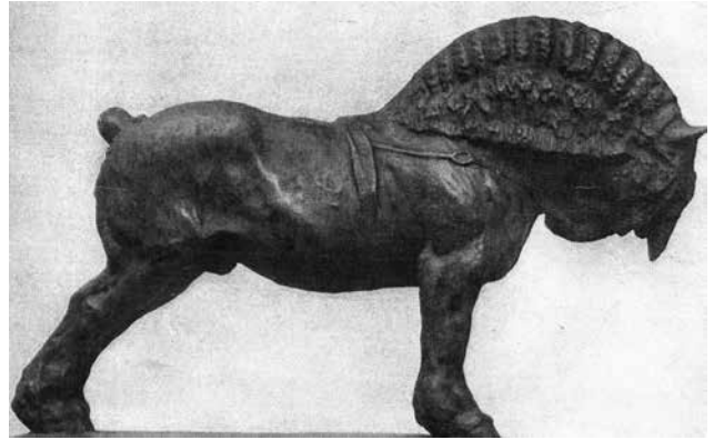
Figuur 6. 'De Bekroonde Hengst', van paardenbeeldhouwer par excellence Domien Ingels, toont een geïdealiseerd beeld met een overweldigende halspartij en een opstaande staartstomp (uit: Gand Artistique 6, 1927, p. 202).