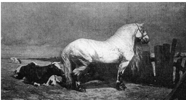
Figuur 11. 'De Hengst' van Alfred Verwee (1869, privé collectie)

decennia van de jaren 1800. Talrijke afbeeldingen gemaakt door de meest gereputeerde dierenschilders, de duurste 'animaliers', tonen immers aan dat men zware dieren met volle staarten, met intacte 'wortel' en 'waaier', mooi vond (Figuur 9 tot 12). Daarvan getuigen tentoonstellingscatalogi en geïllustreerde werken, zoals deze van Eekhoud (1911) en Lemonnier (1896). Klaarblijkelijk werd de mode van het couperen in het laatste derde van de 19 de eeuw bij het Belgisch trekpaard geïntroduceerd. Dit kunnen we afleiden uit de vergelijking van de staartdracht bij de twee allerberoemdste stamvaders: Bayard, geboren in 1864 (Figuur 13) en de nauwelijks vier jaar jongere, in Figuur 5 getoonde Brillant (1868).