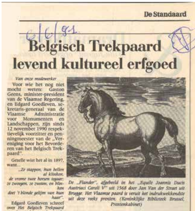
Figuur 9. Levend cultureel erfgoed. Deze vroege (1568), weliswaar geïdealiseerde afbeelding door Jan vander Straet (Brugge) bewaard in het prentenkabinet van de Koninklijke Bibliotheek, Brussel, toont een robuust, atletisch dier met ongeschonden, maar opgebonden staart (krantenknipsel documentatieverzameling Diergeneeskundig Verleden, Merelbeke).