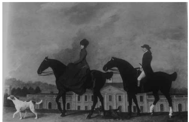
Figuur 14. De ‘upper class’ geeft de toon aan. Dure rijpaarden met gecoupeerde en geangliseerde staartstompen: ‘John and Sophia Musters riding out at Cobwick Hall’ (George Stubbs, 1777). Perfecte lieden op perfecte (maar gecoupeerde) rijdieren in een (voor hen) perfecte wereld.