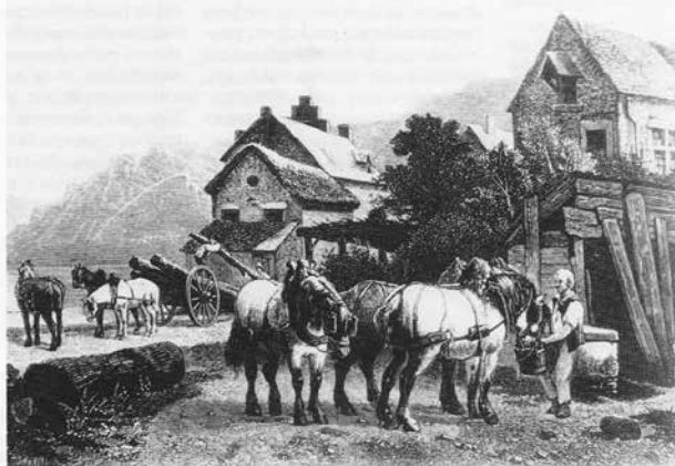
De robustes races de chevaux en Belgique en 1863.