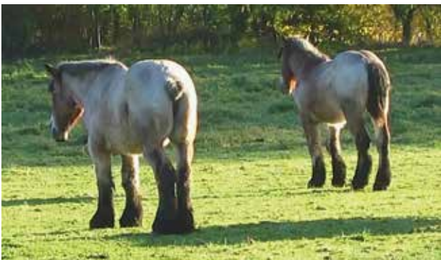
Figuur 2. Gecoupeerd en ongecoupeerd (oud en jong?) samen in de Leiemeersen van de Bourgoyen, Drogen-Gent. De paarden worden er ingeschakeld in het natuurbeheer.