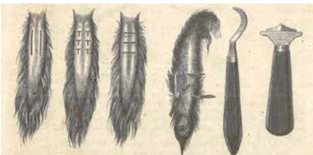
Figuur 3. Verschillende manieren om de staartbuigspiertjes in te snijden, samen met de daarbij gebruikte mesjes: een sikkelvormige tenotoom en uiterst rechts een driehoekige myotoom (uit: Hering, 1866).