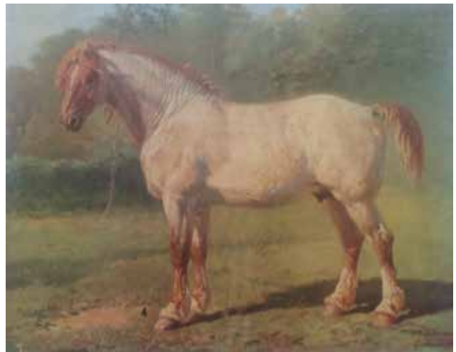
Figuur 13. De kampioenhengst Bayard, geboren in 1864 (werk van Tschaggeny).