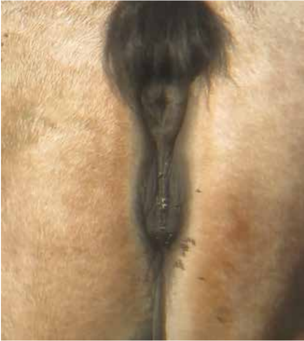
Figuur 1. Onbeschermd perineum en vulva met bijhorende vliegen.