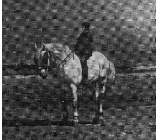
Figuur 12. Alfred Verwee (vóór 1892, privécollectie): ‘Terug van de Prijskamp’. Opmerkelijk is dat deze kunstenaar vasthield aan een ideaalbeeld met ongecoupeerde staart in een tijd dat dit bij kampioenschappen niet meer getolereerd werd.

Bij paarden is dat veel minder, omzeggens niet het geval. Wel terecht gevreesd was destijds het hogervermelde ‘verstrengelen’, meer in het bijzonder bij scheepstrekpaarden. Wanneer het paard ten gevolge