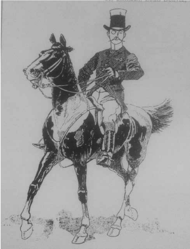
Figuur 15. Hoog gedragen staart ‘en brosse’ bij het rijder van dit autoriteit uitstralend heerschap (ongedaanteerde, niet-geïdentificeerde karikatuur overgenomen uit Gérard, 1988).

daarvan in paniek geraakte, kon dat ernstige gevolgen hebben. Vandaar dat men de haren van de waaiers sterk inkortte bij deze dieren (Lesbre, 1906). Dergelijke ‘rattenstaarten’ waren echter zacht uitgedrukt disgracieus. Populair kon dat gebruik nooit worden.