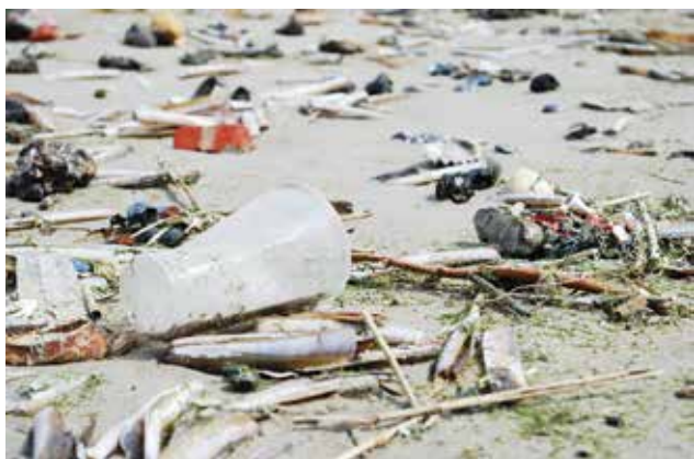
Figuur 1. Plastic afval gevonden aan de vloedlijn, Oostende, België.