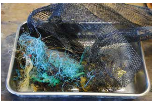
Figuur 2. Plastic afval verzameld uit het mariene milieu.

ten onder de groep van “wegwerpplastics” (Rios et al., 2007). Deze groep bestaat voornamelijk uit verpakkingen en verpakkingsmaterialen, die zeer vaak binnen het jaar na productie worden weggegooid. Wegwerpplastics vertegenwoordigen meer dan een derde van de totale plasticproductie (Andrady, 2011). Logischerwijs resulteert dit in een enorme hoeveelheid plastic afval. Globaal bestaat onze gemiddelde afvalberg voor 10% uit plastics (Barnes et al., 2009; Thompson et al., 2009a). Een deel van dit afval wordt gerecycleerd, de rest wordt verbrand, gestort of komt in het milieu terecht (Hopewell et al., 2009). Van deze laatste vloeit een substantiële hoeveelheid af naar het mariene milieu (Figuur 1). Marien afval zou tot 60-80% uit plastics bestaan (Lusher et al., 2014) en dit kan op sommige locaties oplopen tot meer dan 90% (Derraik, 2002). Zo worden plastics gevonden in zo goed als alle natuurlijke habitats, gaande van de poolcirkels tot aan de evenaar (Barnes et al., 2009; Thompson et al., 2009a). Bovendien zouden plastics als een van de meest persistente vormen van vervuiling in het mariene milieu optreden (Rios et al., 2007; Moore, 2008). Deze moleculen zijn erg resistent tegen fysische en biologische degradatie (Rios et al., 2007; Sivan, 2011). De halfwaardetijd van plastics wordt geschat op honderden tot duizenden jaren en mogelijk