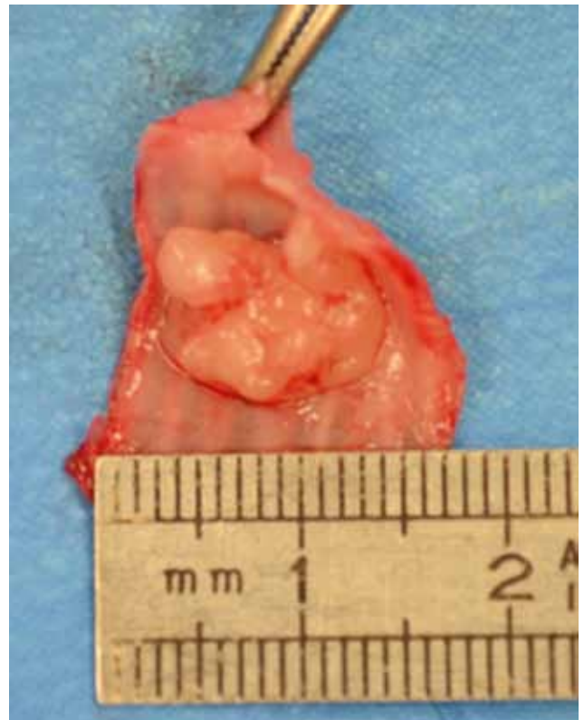
Figuur 3. Geresecceerde deel van de trachea met intraluminale massa. Het geresecceerde deel van de trachea omvatte zeven trachearingen, hetgeen overeenkomt met 16,2 tot 18,4% van de totale trachealengte bij de kat. Na het openen van het lumen was een duidelijk omschreven massa zichtbaar met afmetingen van 1,0 x 1,8 x 1,8 cm.

gecuffte, endotracheale tube (ET). Hierna kon het dier tot het einde van de ingreep mechanisch beademd worden met een TV van 100 ml, een PIP van 10 cm H 2 O en een PEEP van 1 cm H 2 O. Bij inspectie van de trachea werd een mooie appositie zonder overmatige tractie gezien. Kort voor het einde van de ingreep steeg de systolische, arteriële bloeddruk van de patiënt van 100 naar 150 mmHg hoewel deze tijdens de rest van de ingreep stabiel was gebleven rond 80 mmHg. Er werd vermoed dat deze stijging van de bloeddruk te wijten was aan een nociceptieve stimulus, waardoor besloten werd om een bolus fentanyl van 2 µg/kg IV toe te dienen, waarna de bloeddruk terug normaliseerde. De spieren en subcutis werden doorlopend gesloten met poliglecaprone 4/0 en de huid werd intradermaal gesloten met hetzelfde hechtmateriaal. De totale duur van de anesthesie bedroeg 2 uur en 50 minuten. De fentanyl CRI, de alfaxalone CRI en de mechanische beademing werden stopgezet en het hernemen van de spontane ademhaling werd visueel en aan de hand van capnografie opgevolgd. Het duurde een drietal minuten vooraleer de patiënt herstelde van apnee. Ondertussen werd de ademhaling een aantal keer manueel ondersteund via druk op de ademballon, waarna deze geleidelijk stabiliseerde op een frequentie van 17 ademhalingen per minuut. Om de postoperatieve analgesie te verzekeren werd