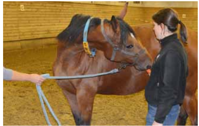
Figuur 2. Door middel van een wortel wordt getest of de hals vlot geplooid kan worden. Het paard moet zonder problemen de thorax kunnen bereiken zonder dat het hoofd extreem gekanteld of de hals naar beneden gebracht moet worden.

Na deze algemene observatie wordt het paard van dichtbij bekeken. De meeste klinici verkiezen een vaste van-kop-tot-staart-benadering omdat dit de kans verkleint dat afwijkingen over het hoofd gezien worden. In Tabel 1 wordt weergegeven welke testen gebruikt worden om de functionaliteit van de verschillende kopzenuwen te beoordelen. Heel belangrijk betreffende het zicht van het paard is de dreig- en de pupilreflex. Blindheid wordt enerzijds getest door het paard in een vreemde omgeving te laten bewegen maar bij paarden met een abnormaal bewustzijn of