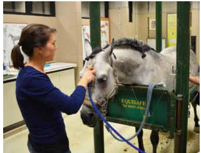
Figuur 4. Transcraniële, magnetische stimulatie bij een gesedeerd paard. De coil wekt een veranderend magnetisch veld op en stimuleert zo de motorische cortex. Het signaal dat hierdoor via de motorische zenuwbanen doorgegeven wordt naar de spieren wordt daar door middel van een elektrode geüpapt. De tijd tussen stimulatie en registratie en de amplitude van het signaal geven de kwaliteit van de zenuwgeleiding weer.

Bij paarden in laterale decubitus kunnen de spinale reflexen getest worden. Een intacte reflex wijst op een normale sensorische zenuw, geen afwijkingen in het specifieke ruggenmergsegment en een normale motorische zenuw. Het paard kan per definitie een normale reflex vertonen zonder de prikkel effectief be-