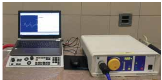
Figuur 5. De noodzakelijke apparatuur voor het uitvoeren van een MMEP-test. Links een standaard EMG-toestel (Synergy UltraPro) en rechts de magnetische stimulator (Magstim 200).

wust waar te nemen. De buigreflexen ter hoogte van het voorbeen worden getest door een prikkel (knippen in de huid, naaldenprik) te geven ter hoogte van de distale ledematen waarna het been opgetrokken moet worden. Een abnormale reflex kan verklaard worden door een letsel ter hoogte van de sensorische of motorische zenuw of ter hoogte van het ruggenmerg van C6-T2. Bijkomend kan de biceps- en tricepsreflex getest worden. Door stimulatie van de respectievelijke spieren met een reflexhamer moeten deze reflexmatig contraheren. Hiermee worden respectievelijk de ruggenmergsegmenten C6-C7 en C7-T1 getest. Deze reflexen zijn wel gemakkelijker waarneembaar bij veulens dan bij volwassen paarden. Als laatste kan de patellareflex geüpapt worden door het been licht te buigen en de rechte patellaband kort aan te kloppen met de reflexhamer. Een verminderde respons komt voor bij paarden met aantasting van het ruggenmerg ter hoogte van L3-L4, botulisme of aantasting van de nervus femoralis. Voor al deze reflexen geldt dat een versterkte reflex verklaard kan worden door UMN-