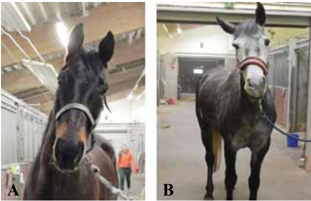
Figuur 1. A. “Head tilt” naar links bij een paard met otitis media en interna ter hoogte van het linkeroor. B. “Head tilt” naar rechts met facialisparalyse rechts (afhankelijk oor, ooglid en lip) veroorzaakt door otitis media en interna ter hoogte van het rechteroor.