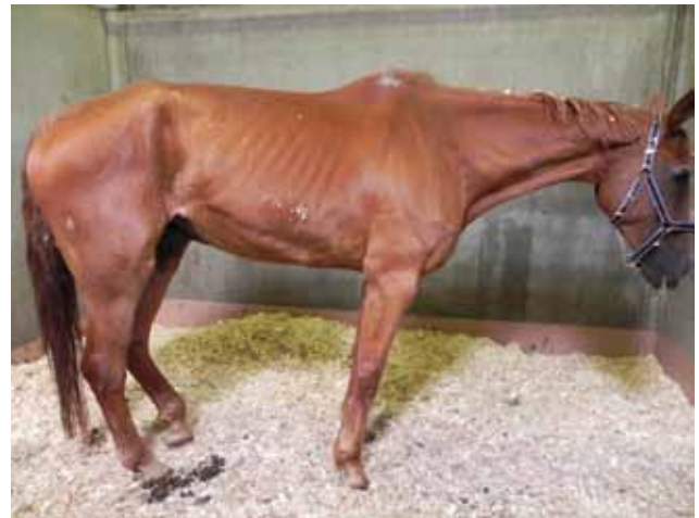
Figuur 3. Paard met vrij typische symptomen van “equine motor neuron disease”. Het paard staat met opgetrokken buik. Vaak vertonen ze spiertrillingen en houden ze de staart in abnormale positie. De ledematen staan te ver onder de massa geplaatst.

Waar mogelijk kan dit onderzoek aangevuld worden met het lopen op een helling, het blinddoeken van het paard of bewegen met het hoofd omhoog om de symptomen te accentueren. Mogelijke, vast te stellen afwijkingen in de beweging zijn: dysmetrie (hyper- of hypometrie met slepen van de teen), incoördinatie (ataxie), parese, zwakte of specifieke afwijkingen ten gevolge van zenuwuitval, bijvoorbeeld radialispara-