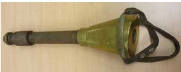
Figuur 3. Slagtoestel voor pen ingeslagen met hamer: zie Figuur 2 (Museumcollectie Diergeneeskundig Verleden Merelbeke, UGent).