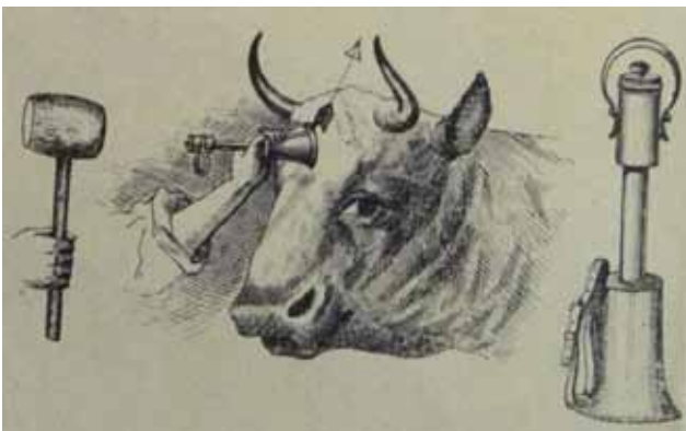
Figuur 2. Illustratie uit Rühl, J. (1914). Notice sur l'abattoir de Bruxelles. Exposé sur quelques réformes en matière d'abattage. In: Nos Meilleurs Amis , jg. 22 nr. 6, p. 63. Dit was het tijdschrift van de Brusselse vereniging voor dierenbescherming die deze manier van 'slaan' propageerde.