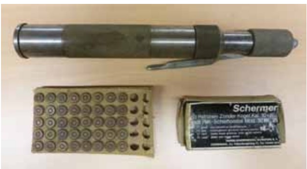
Figuur 4. 'Schermer' schiettoestel met patronen (Museumcollectie Diergeneeskundig Verleden Merelbeke, UGent).

delijk omwille van de praktische voordelen die het werken met een bewusteloos dier biedt, 'sloeg' men voorafgaand aan het eigenlijke doden. 'Slaan' was essentieel, althans bij ons en in de ons omringende West-Europese landen. In alle Germaanse talen vinden we dat woord terug in de bij het doden van dieren voor consumptie gebruikelijke terminologie: slachten, slachthuis, enz., afgeleid van 'slaan'. Denk ook aan het Franse abatre en abattoir, afgeleid van bâton (knots, stok). In Engeland bleef de lokale, grotendeels Germaans sprekende, Angelsaksische boerenbevolking varkens, runderen en schapen slachten ('slay, slaughter'), maar ze waren in 1066 verslagen ('they were beaten') door de geromaniseerde Normandiërs, die wisten wat 'battre' was en die hun nieuwe onderdanen ook wel eens durfden trakteren op stokslagen (beats). Vanzelfsprekend werd ook het militaire jargon van deze heren aan het Frans ontleend: 'battle' van 'bataille', 'battle field', enz., allemaal termen die teruggaan op de primitieve knots.