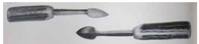
Figuur 6. ‘Kollisteek’ (uit: ‘Moderne beenhouwerij en charcuterie’, 1965).