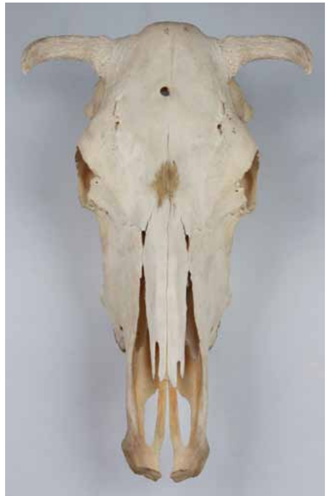
Figuur 5. Runderschedel met schietgat (MuMo, museumcollectie vakgroep Morfologie, Faculteit Diergeneeskunde, UGent, Merelbeke).

Bij het einde van dit tekstgedeelte moet nog iets gezegd worden over de uitdrukking ‘humaan slachten’ (humane slaughter). In het Engels is de term al meer dan een eeuw in gebruik, maar in het Nederlands is hij niet zomaar acceptabel. De term is dubieus. Duidt hij op een goedaardige, of minstens niet-wreedaardige manier van handelen? In tegenstelling tot wat het woord suggereert, is dit allesbehalve een universeel kenmerk van de menselijke soort. Of duidt dit op manieren van slachten die de gevoelens van mensen ontzien? De stadsmens anno 2016 wil het allerbeste voor zijn ‘pets’, maar wil niet geconfronteerd worden met het slachten, wil ook geen kadavers of karkassen zien, enkel netjes verpakte lapjes en hamburgers of onherkenbaar verwerkt vlees in klaargemaakte hapjes (12).