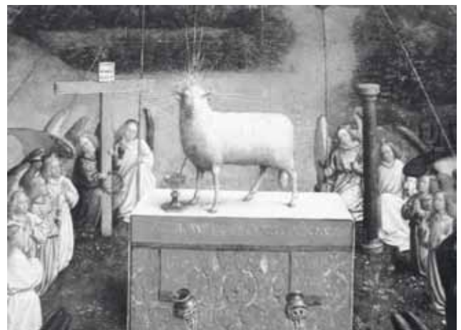
Figuur 9. Detail uit het Lam Godsretabel in de Gentse Sint-Baafskathedraal. In deze theologisch goed onderbouwde voorstelling wordt het lam weergegeven als een flink uit de kluiten gewassen volwassen dier, wellicht een eenjarige ram zoals het voorschrift in de Thora voor het pesah (paas)maal vereist.

Verdedigers van het niet bedwelmde slachten om religieuze redenen stellen dat een levenslange goede behandeling van de huisdieren veel belangrijker is dan de korte doodstrijd. Het is een stelling die ook verwoord wordt in meer neutrale werken die het gedrag van mensen tegenover dieren beschrijven (23). Dieren die als vee kunnen gehouden worden en last-