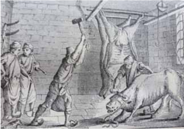
Figuur 1. Prent van Moreau le jeune (1765, detail).