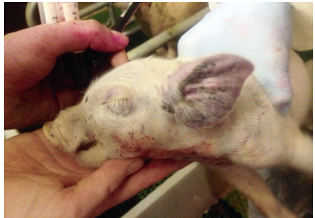
Figuur 2. Big met trombocytopenische purpura. Cyanotische verkleuring van de oren.