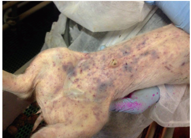
Figuur 1. Big met trombocytopenische purpura. Subcutane hemorragieën ter hoogte van het abdomen en tussen de achterpoten.

Er is geen effectieve behandeling voor aangetaste biggen, zelfs niet wanneer TP snel wordt gediagnosticeerd. Doorgaans sterven aangetaste biggen of moeten ze worden geëuthanaseerd (Forster, 2007; Karlens et al., 2013). Men kan er wel voor zorgen dat de incompatibiliteit tussen zeug en fetale trombocytantigen niet bevorderd wordt. Hiervoor moet worden nagegaan of aangetaste tomen telkens van dezelfde zeug afkomstig zijn (Galletti et al., 2010). Zeugen die herhaaldelijk aanleiding geven tot tomen met TP, worden het beste opgeruimd. Als dit niet mogelijk is, moet er gewerkt worden met pleegzeugen voor er colostrum wordt opgenomen. In alle andere gevallen waarbij er geen duidelijke link bestaat met bepaalde zeugen, moet de focus op beerniveau gericht worden (Jackson en Cockcroft, 2007; Galletti et al., 2010). Er moet vermeden worden dat sperma van telkens dezelfde beer in opeenvolgende rondes gebruikt wordt en/of dat er spermadosen aangekocht worden van meerdere beren.