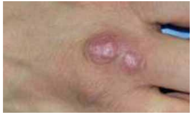
Figuur 2. Patiënt met een infectie met Mycobacterium marinum aan de hand, zogenaamd “zwimmersgranuloma”. (Bron: Cassetty en Sanchez, 2004; met toestemming van en dank aan Dermatology Online Journal).

Een snellere diagnostische techniek voor de specifieke detectie van M. marinum is het gebruik van