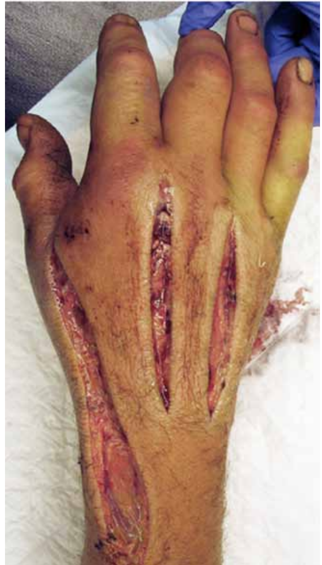
Figuur 4. Chirurgisch debrideren door middel van een berenklauwincisie in de hand, ter behandeling van necrotiserende fasciitis door Vibrio vulnificus (Bron: Dijkstra et al., 2009; met toestemming van en dank aan het Nederlands Tijdschrift voor Geneeskunde).

Vibrio vulnificus ( V. vulnificus ) is een gramnegatieve, facultatief anaërobe zout- en brakwaterbacterie die vooral voorkomt in warme waters (Lowry en Smith, 2007; Cañigral et al., 2010). V. vulnificus kan ernstige ziekte en sterfte veroorzaken bij onder andere paling ( Anguilla anguilla ) en gaffelmakreel ( Trachinotus ovatus ) (Austin, 2010). Orale infectie na consumptie van hoofdzakelijk besmette schelpdieren komt het meest frequent voor. Wondinfectie met V. vulnificus na contact met vissen komt minder frequent voor en verloopt meestal minder ernstig (Lowry en Smith, 2007; Austin, 2010). In de Verenigde Staten van Amerika is een zoönose door V. vulnificus aangifteplichtig (CDC, 2013). Subtypering van V. vulnificus is van belang om na te gaan of men met een zoönotische stam te maken heeft (Haenen et al., 2014).