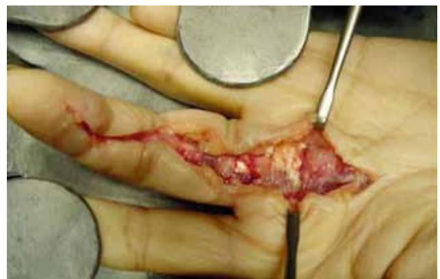
Figuur 3. Synovectomie van de buigpees van de linkermiddelvinger ter behandeling van een infectie met Mycobacterium marinum (Bron: Cheung et al., 2010a; met toestemming van en dank aan Dr. J.P.Y. Cheung).

“kwantitatieve polymerase chain reaction” (qPCR) gericht op de erp en IS2404 genen. Met deze technieken is er al resultaat binnen zes uur (Slany et al., 2013). De sensitiviteit van qPCR verschilt niet significant van deze van cultuur (Portaels et al., 1997; Parikka et al., 2012).