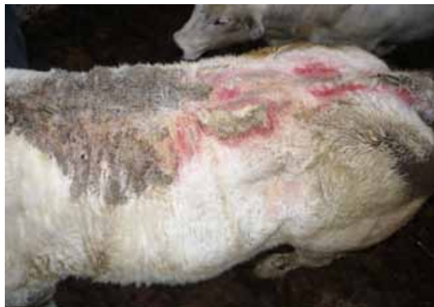
Figuur 1. Dorsaal zicht van een met P. ovis aangetaste BWB-koe.

In een studie uitgevoerd op Vlaamse rundveebedrijven werd aangetoond dat de bedrijfsprevalentie van schurft op vleesveebedrijven in Vlaanderen ongeveer 75% bedraagt (Sarre et al., 2012). Hoewel veel bedrijven besmet zijn, worden tussen verschillende bedrijven grote verschillen opgemerkt wat de ernst van de aandoening betreft. Algemene managementfactoren, zoals hygiëne (frequentie van het instrooien) en aankoopbeleid, kunnen hierbij een rol spelen (Sarre et al., 2012). Naast deze risicofactoren werd ook aangetoond dat 75% van de ondervraagde veehouders een incorrect behandelingsschema aanhoudt, waarbij vooraf geen diagnose gesteld wordt, een verkeerde formulatie van het product wordt gebruikt, slechts