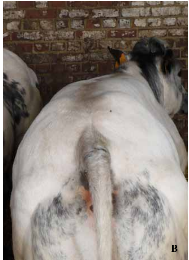
Figuur 3A en B. Voorbeeld van aangetast dier A. vóór en B. na behandeling.

Op drie bedrijven (bedrijf 3, 4 en 7) werden sommige runderen (bijkomend) tweemaal behandeld met amitraz (Intervet Int. via MSD AH, België), met een interval van zeven à tien dagen, wanneer een menginfectie met C. bovis aanwezig was of wanneer dieren vetgemest werden en producten met een korte wachttijd nodig waren.