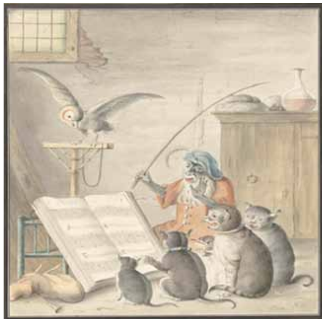
Figure 3. Concert miaulique par Cornelis Hermansz. Saftleven (1607-1681).

Depuis le célèbre ouvrage Man and the Natural World (1983) de l'Anglais Keith Thomas, historien de la culture, les Human-animal studies mettent en évidence la profonde ambivalence qui caractérise, depuis des siècles, les relations entre les hommes et les animaux. Alors que depuis le bas Moyen Âge, suite à l'expansion économique et démographique, l'exploitation et la destruction de l'animal ont pris une ampleur toujours plus grande, le besoin de traiter un nombre toujours croissant d'animaux de façon bienveillante, voire affectueuse, s'est développé également 86 . Divers auteurs parlent d'une transition de l'instrumentalisation à la sentimentalisation, de l'utilisation à l'affection 87 ou plus spécifiquement, dans le cas qui nous préoccupe, des "Katzen im Feuer" aux "Katzen am Feuer" 88 . Le chat a moins profité de cette évolution que d'autres animaux domestiques, comme le chien. Pendant des siècles, des intellectuels – ecclésiastiques pour la plupart – ont pourtant décrit de manière assez objective les caractéristiques du chat et une sorte de symbiose s'est développée dans la vie de tous les jours entre certains religieux et l'animal. Mais au cours du XII e siècle, les choses changent. Le chat se voit affubler d'une mauvaise réputation. Ce n'est pas tant le christianisme lui-même qui en est le responsable, mais plutôt l'émergence d'une Église