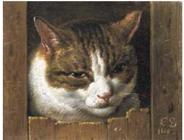
Figure 2. Chat dépassant d'une clôture par Cornelis Hermansz. Saffleven (1666).

Nous avons vu dans la section précédente que les chats, tant dans la littérature que dans l'iconographie, symbolisent souvent des caractéristiques négatives. Cela change au cours du XVII e siècle 19 . Le chat fait l'objet d'une réhabilitation. On vante ici et là son besoin de liberté, son ingéniosité et son sens de la propriété 20 . Il devient même partie intégrante d'un nouveau décor, celui de la maison joliment aménagée 21 . Dans le même temps, les illustrations évoluent également. À partir de la seconde moitié du XVII e siècle, le chat perd une grande partie de sa valeur symbolique et emblématique. Les représentations métaphoriques et allégoriques font place aux tableaux réalistes ayant comme décor le foyer quotidien. Peindre des animaux devient un genre à part entière, où les arrière-pensées et les leçons de morale sont bannies. Pour les chats aussi, "le vocabulaire compliqué de la métaphore déguisée et faussement réaliste" a disparu 22 . Désormais, le chat est plus représenté qu'imaginé. Il apparaît endormi, jouant ou espiègle sur des images de la Sainte Famille 23 , mais aussi bien en vue dans un cadre familial: sur un banc près d'une femme qui lit 24 , à côté de gens qui filent et tissent à la maison 25 . Sur des tableaux gracieux, on voit le chat aux pieds de la mère et de l'enfant 26 ou sur les genoux d'une