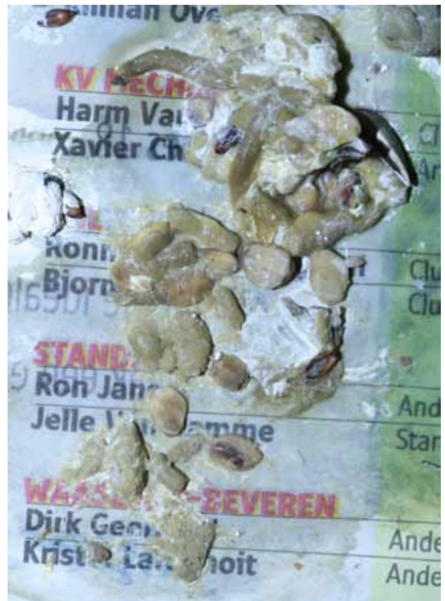
Figuur 1. Een groot aantal onverteerde zaden in de mest van een rosé kaketoë ( Eolophus roseicapillus ) met kliermaagdilatatiesyndroom.

Het kliermaagdilatatiesyndroom (KDS) veroorzaakt door aviair bornavirus (ABV) is een fatale neurologische aandoening die voornamelijk bij psittaciformen vastgesteld wordt (Guo et al., 2014; Hoppes et al., 2010 en 2013; Rubbenstroth et al., 2012). Tot op heden werden KDS en ABV-infectie bij meer dan tachtig soorten psittaciformen beschreven (Hoppes et al., 2013). Er wordt aangenomen dat wilde vogels als reservoir van ABV kunnen fungeren (Berg et al., 2001). KDS is ook bekend als ‘macaw wasting disease’ aangezien de aandoening voor de eerste maal beschreven werd in het begin van de jaren zeventig van de vorige eeuw bij ara's die vanuit Boliviaë naar Europa en Noord-Amerika geïmporteerd werden (Hoppes et al., 2010). Ondertussen wordt KDS wereldwijd vastgesteld. De kliermaagdilatatie die bij klinisch geïnfectede vogels gezien wordt, is het gevolg van virus-geïnduceerde, immunologische schade ter hoogte van het autonome, gastro-intestinale zenuwstelsel (Gancz et al., 2010; Hoppes et al., 2013). De meest voorkomende symptomen die optreden ten gevolge van deze lymfoplasmocytair ganglionneuritis met dilatatie van de kliermaag zijn regurgitatie, kropstase, gewichtsverlies met dikwijls opvallende atrofie van de pectoraalspieren en maldigestie met eventuele aanwezigheid van onverteerde zaden in de mest (Hoppes et al., 2010) (Figuur 1). De ziekte kent veelal een chronisch verloop en wordt uiteindelijk