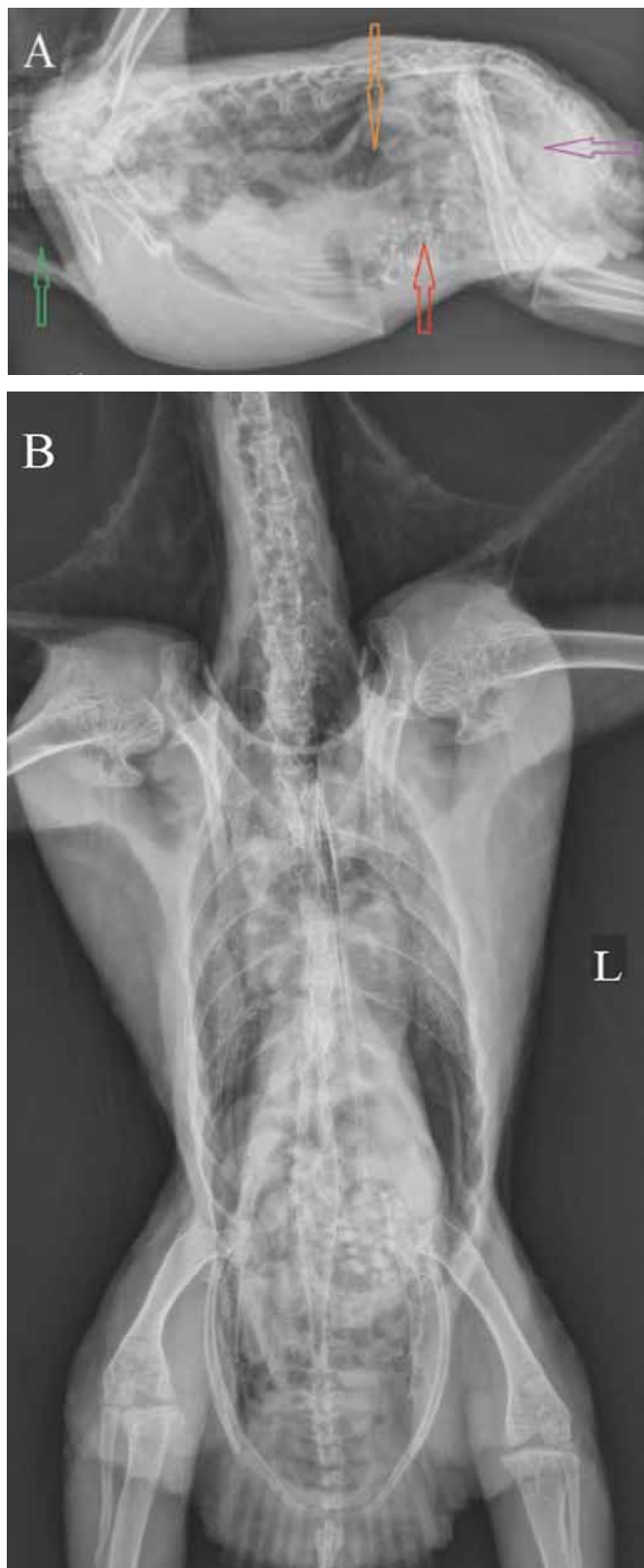
Figuur 3. Laterale (A) en ventrodorsale (B) opname van het coelom van een edelpapegaai ( Ecliptes roratus ). A. De krop is gevuld met gas (groene pijl). De proventriculus is gedilateerd (ratio 0,94) en gevuld met gas (oranje pijl). De ventriculus bevat grit en gas (rode pijl). Veralgemeende dilatatie van de darmen en aanwezigheid van een matige hoeveelheid gas (paarse pijl).