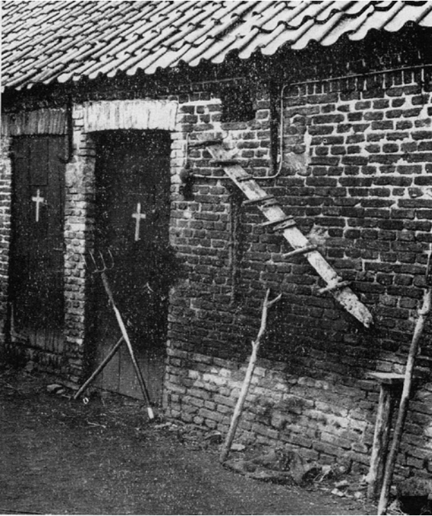
Figuur 2. Staldeuren met geschilderde kruisen bij een boerderijtje in de Brandemanstraat in Laarne naast Wetteren. Ook de gekruiste bezems waren bedoeld om hekserij af te weren.

christelijke tradities. Het zijn praktijken die teruggaan op het oeroude geloof in de helende en zuiverende kracht van water.