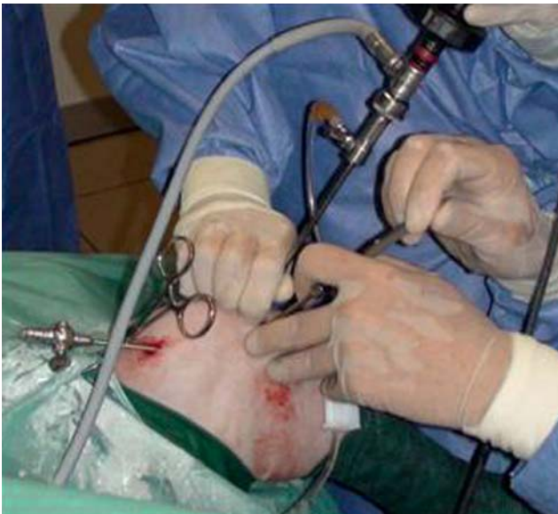
Figuur 3. Artroscopie van de knie. Beeld van de uitwendige opstelling met de artroscopie en de instrumenten- en canule ter plaatse.