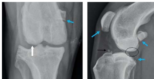
Figuur 2. Craniocaudale (links) en mediolaterale (rechts) radiografische opname van de rechter knie van de hond. Op de craniocaudale opname is een afplatting van de laterale femurcondyl zichtbaar. Op de mediolaterale opname worden een radiolucente zone (omcirkeld) en enkele fragmenten ter hoogte van het proximale deel van het tibiaal plateau (zwarte pijl) gezien. De blauwe pijlen wijzen op plaatsen waar een lichte artrotische reactie zichtbaar is.

Als therapie werd de artroskopische verwijdering van de fragmenten in beide knieën aangeraden, te beginnen met de rechter knie waarop het dier volgens de anamnese mank liep. De hond werd onder algemene