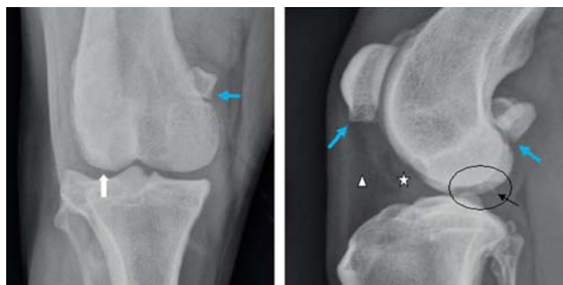
Figuur 1. Craniocaudale (links) en mediolaterale (rechts) radiografische opname van de linker knie van de hond. Op de craniocaudale opname is een afplatting van de laterale femurcondyl zichtbaar. Op de mediolaterale opname worden een radiolucente zone (omcirkeld) en enkele fragmenten (zwarte pijl) gezien. De blauwe pijlen wijzen op plaatsen waar een lichte artrotische reactie zichtbaar is.

Op de mediolaterale projectie van de linker knie was een milde craniale verplaatsing van het infrapatellaire vetkussen te zien (Figuur 1). Het fasciale vlak was een beetje naar caudaal verplaatst door een weke delenopaciteit. Dit wees op milde gewrichtseffusie. Op deze opname was ook een radiolucent, halvemaan-