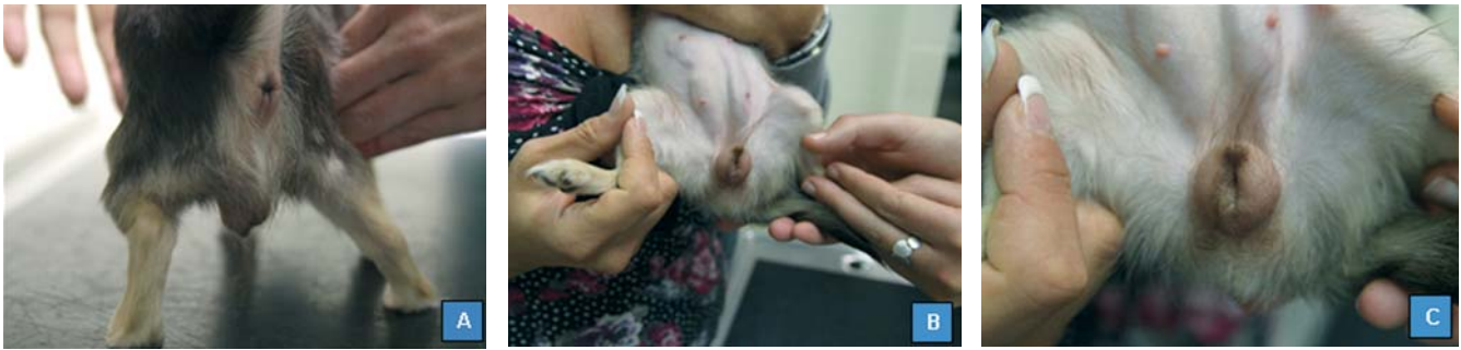
Figuur 2. Het initiële consult. A. vergrote, naar ventraal verplaatste vulva, B. vergrote vulva en sterk opgezette inguinale en caudaal abdominale melkklieren, C. detailopname: vergrote vulva en sterk opgezette inguinale melkklieren.

sex reversed honden zijn teven op basis van hun 78, XX-karyotype, maar door de aanwezigheid van hetzij ovarieel en testiculair weefsel, hetzij enkel testiculair weefsel, wijzigt dit besluit. In het eerste geval wordt de hond geclassificeerd als een XX-ware hermafrodit, in het laatste geval als een XX-reu (op basis van het gonadale geslacht). In het algemeen wordt de diagnose van waar hermafroditisme gesteld door een histopathologisch onderzoek van de gonaden uit te voeren na castratie van de hond. Een ware hermafrodit heeft dus tenminste één ovotestis ofwel één ovarium en één testis (het zogenaamd lateraal hermafroditisme). Een XX-reu blijkt daarentegen in het bezit te zijn geweest van bilaterale testes. In een overzichtsartikel vermeldde Poth et al. (2010) twee zeldzame gevallen van XY sex reversed honden (een fox terriër en een yorkshire terriër) met lateraal hermafroditisme. Bij de Amerikaanse cocker spaniël is XX sex reversal een erfelijke aandoening met een autosomaal recessief overervingspatroon (Meyers-Wallen en Patterson, 1988).