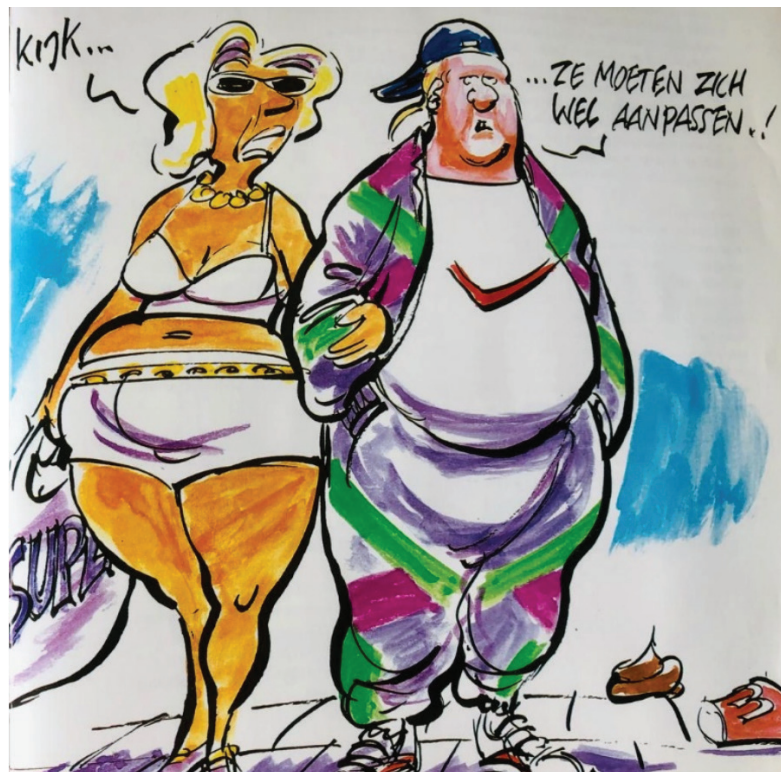
Figuur 1: afbeelding bij hoofdstuk ‘Buitenlanders willen zich niet aanpassen’ in Vooroordelen vertekenen (Anne Frank Stichting 1997: 50-51, tekenaar Tom Janssen)

De minachting van ‘de andere Nederlander’ door OSM richt zich vooral op lageropgeleiden. 1 Ironisch genoeg treffen we dit vooral aan onder groepen die zich in het algemeen juist laten voorstaan op hun tolerantie, en hun uiterste best doen om vooroordelen te bestrijden. De in Figuur 1 getoonde afbeelding maakt dit bijvoorbeeld pijnlijk duidelijk. Deze komt uit het boek Vooroordelen vertekenen van de Anne Frank Stichting (pp. 50-51), mede gefinancierd door het ministerie van Onderwijs, Cultuur en Wetenschappen. Dat boek, en ik citeer, ‘geeft feiten, cijfers en argumenten tegen veelgehoorde vooroordelen over migranten’ (1997: 5). Afbeeldingen als deze zijn bedoeld om ‘de irrationele kant van vooroordelen [te laten] zien’ (achterflap). In voornoemde column van Herzberger legt ze de NRC-lezer plagerig voor: ‘U vindt het vermoedelijk makkelijker om belangstelling en empathie op te brengen voor een willekeurige migrant [...] dan voor de “andere Nederlander”’. De nietsontziende verzameling negatieve vooroordelen waarmee die ‘andere Nederlander’ hier wordt afgebeeld suggereert dat hier van meer sprake is dan een vermoeden.