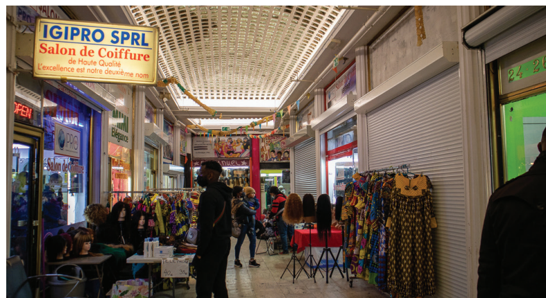
Afbeelding 8: Winkels en straatverkopers in de Matongegalerij