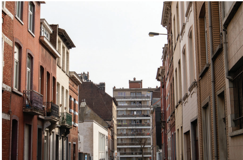
Afbeelding 17: Residentiële straat