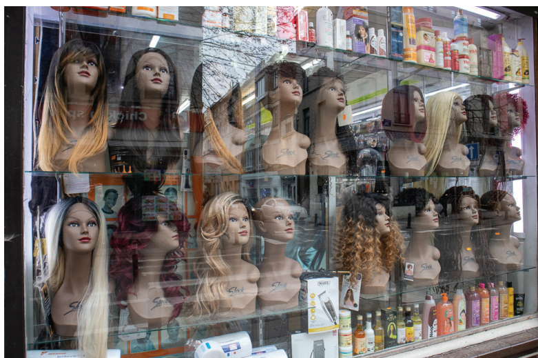
Afbeelding 10. Pruiken en schoonheidsproducten in een winkelraam

De respondenten benadrukken dat niet alles in Matonge Afrikaans is. Het Sint-Bonifatiusplein is bij mooi weer één groot terras. De restaurants hier serveren Italiaanse, Belgische, Japanse, Franse of Koreaanse keuken en de inrichting en uitstraling verschillen van de Afrikaanse restaurants verderop in de wijk. Rond dit plein zijn er verschillende koffiebars, takeawayrestaurants, warme bakkers en cafés. Vooral Lies en Jolien gaan af en toe iets eten of drinken op het plein. Niet iedereen ziet dit plein als deel van Matonge. Zo stelde Geert, de Vlaming die het meest gebruikt maakte van de Afrikaanse voorzieningen: ‘ah nee dat zijn totaal verschillende buurten die niks met elkaar te maken hebben’. Lies ziet het plein als een overgangszone tussen de Europese wijk, net boven Matonge en Sint-Bonifatius gelegen, en het ‘Afrikaanse Matonge’.