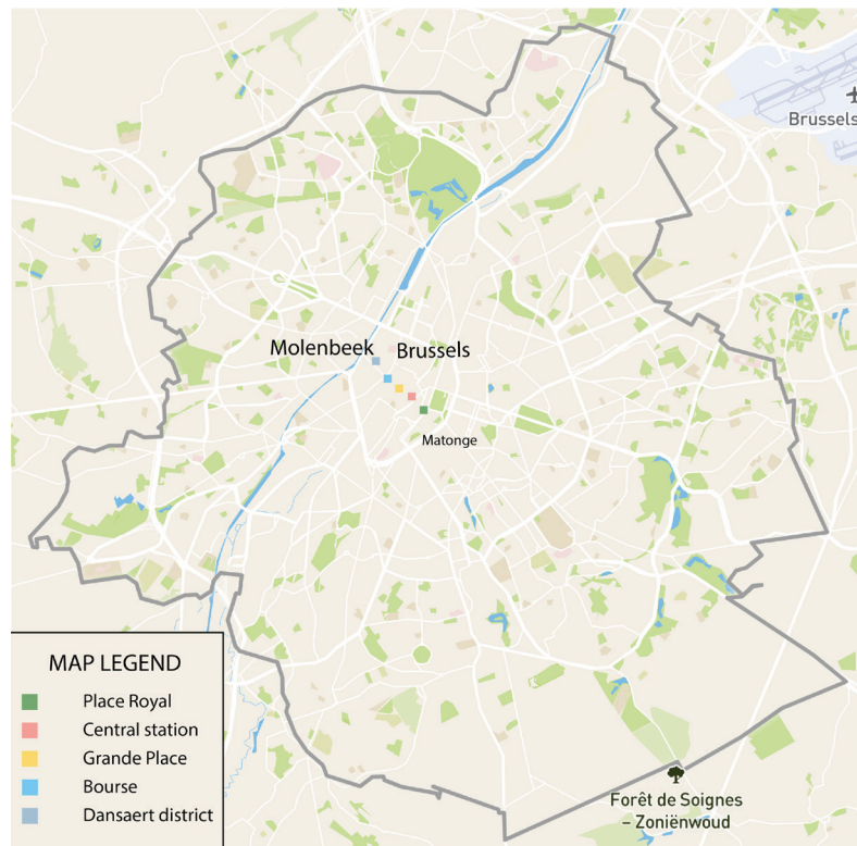
Afbeelding 1: Kaart Brussels hoofdstedelijk gewest

segregatie tussen buurten die door de relatief kleine omvang van de stad goed met het centrum en elkaar verbonden zijn (Corijn en Van de Ven 2013). Toenemende ongelijkheid heeft geleid tot een tweedeling tussen het rijkere zuidoosten, versus het noordwestelijk deel dat ook de ‘arme halve maan’ of ‘arme croissant’ genoemd wordt (Van Hamme 2010). In de arme halve maan wonen veel mensen met een migratieachtergrond. Vaak gaat het om transitbuurten waar migranten aankomen, en blijven wonen omwille van economische redenen, soms generaties lang (Van Hamme et al. 2016).