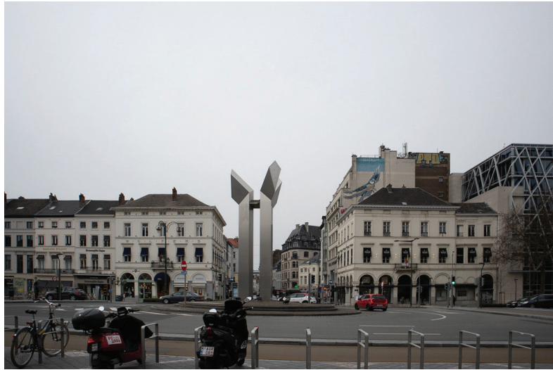
Afbeelding 4: Naamsepoort