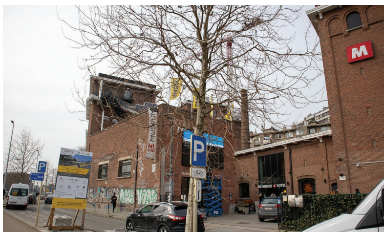
Afbeelding 19: Museum en hostel aan het kanaal