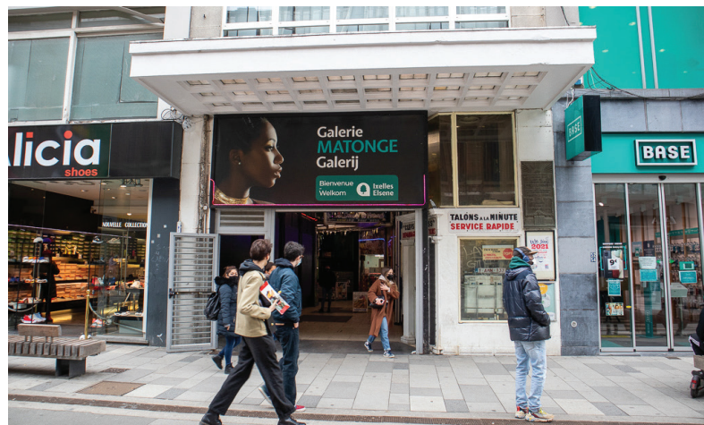
Afbeelding 7: Ingang van de Matongegalerij