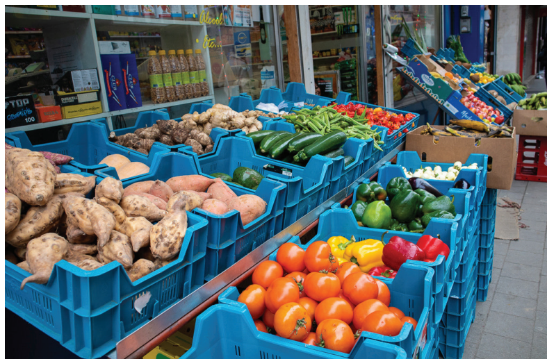
Afbeelding 9: Bon marché

Afrikanen vanuit Frankrijk, Nederland, het westen van Duitsland die komen naar hier hun inkopen doen dus die kopen dan ja al die bakbananen, palmolie, maniok. Ge hebt hier ook al de banjestoffen enzo natuurlijk. Ge zult zien dat er veel cafés en restaurants zijn omdat het dus echt een ontmoetingswijk is. (Geert, Matonge)