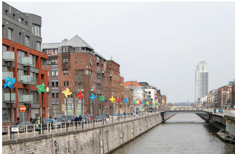
Afbeelding 12: Het kanaal

Ook Molenbeek is makkelijk bereikbaar vanaf het Centraal Station. Een wandeling van ongeveer twintig minuten brengt je tot aan het kanaal, een fysieke maar vooral symbolische grens tussen het centrum en Molenbeek. Wanneer je via deze route Molenbeek binnenwandelt, kom je uit op de Gentssteenweg.