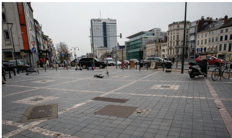
Afbeelding 6: Lumumbaplein