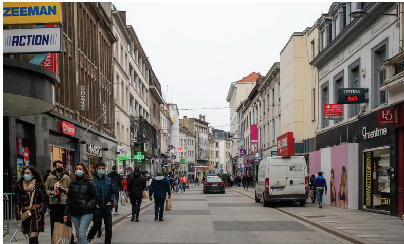
Afbeelding 5: Elsensesteenweg