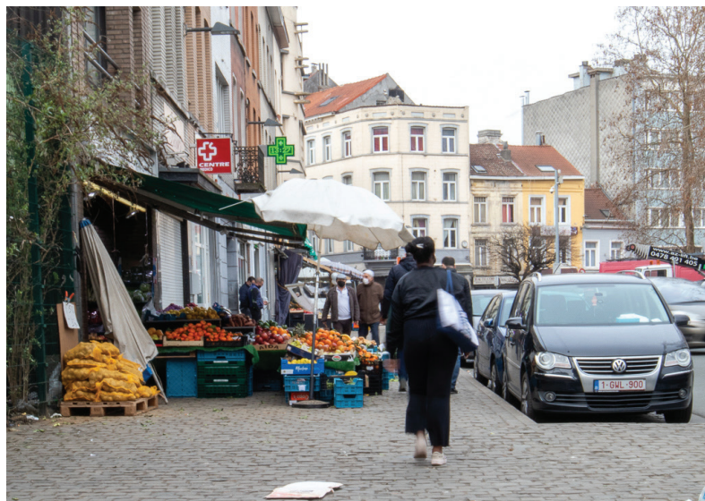
Afbeelding 16: Bon Marché

We hebben ook veel communautaire tuinen, alles is intern, pas pour le quartier. Je hebt daar het kanaal, le Chien Verte, waar een type mensen wonen. Classe Moyenne, Vlamingen, die komen hier. (Oubayd, Molenbeek)