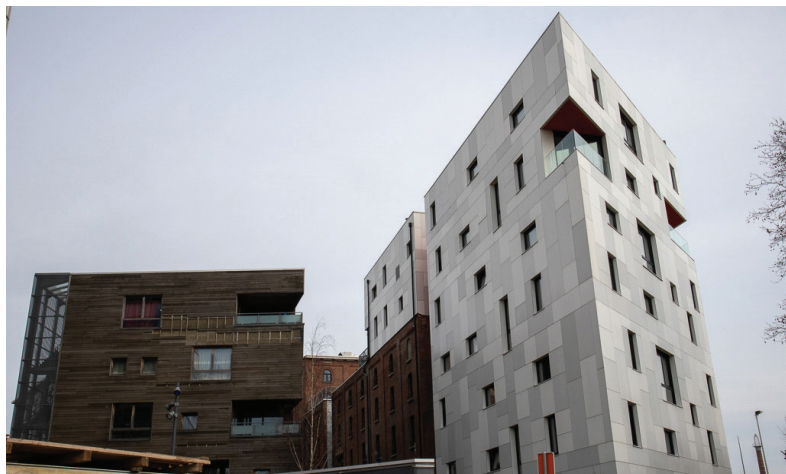
Afbeelding 18: Residentiële toren in de kanaalzone