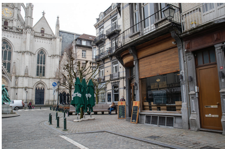
Afbeelding 11: Sint-Bonifatiusplein

De respondenten benadrukken dat niet alles in Matonge Afrikaans is. Het Sint-Bonifatiusplein is bij mooi weer één groot terras. De restaurants hier serveren Italiaanse, Belgische, Japanse, Franse of Koreaanse keuken en de inrichting en uitstraling verschillen van de Afrikaanse restaurants verderop in de wijk. Rond dit plein zijn er verschillende koffiebars, takeawayrestaurants, warme bakkers en cafés. Vooral Lies en Jolien gaan af en toe iets eten of drinken op het plein. Niet iedereen ziet dit plein als deel van Matonge. Zo stelde Geert, de Vlaming die het meest gebruikt maakte van de Afrikaanse voorzieningen: ‘ah nee dat zijn totaal verschillende buurten die niks met elkaar te maken hebben’. Lies ziet het plein als een overgangszone tussen de Europese wijk, net boven Matonge en Sint-Bonifatius gelegen, en het ‘Afrikaanse Matonge’.