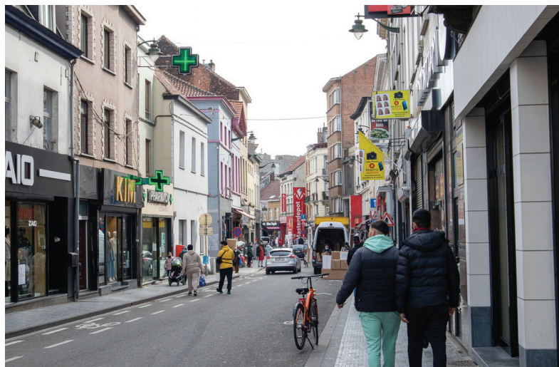
Afbeelding 13: De Gentsesteenweg