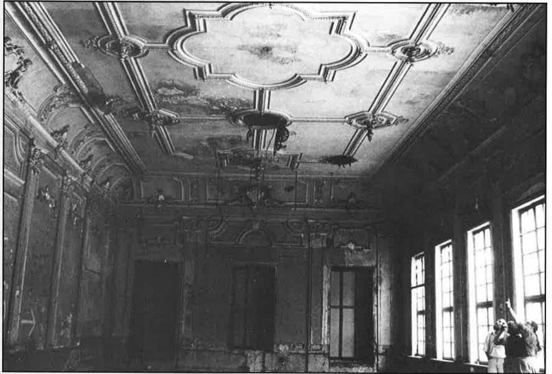
Het oorspronkelijk stuc-plafond met casetten-indeeling, rozetten (aanhechtingspunten voor luchters) en verluchttingsroosters van de voormalige feestzaal Nemrod gerealiseerd in 1852 door ornamentgieter F.J. Delanier.