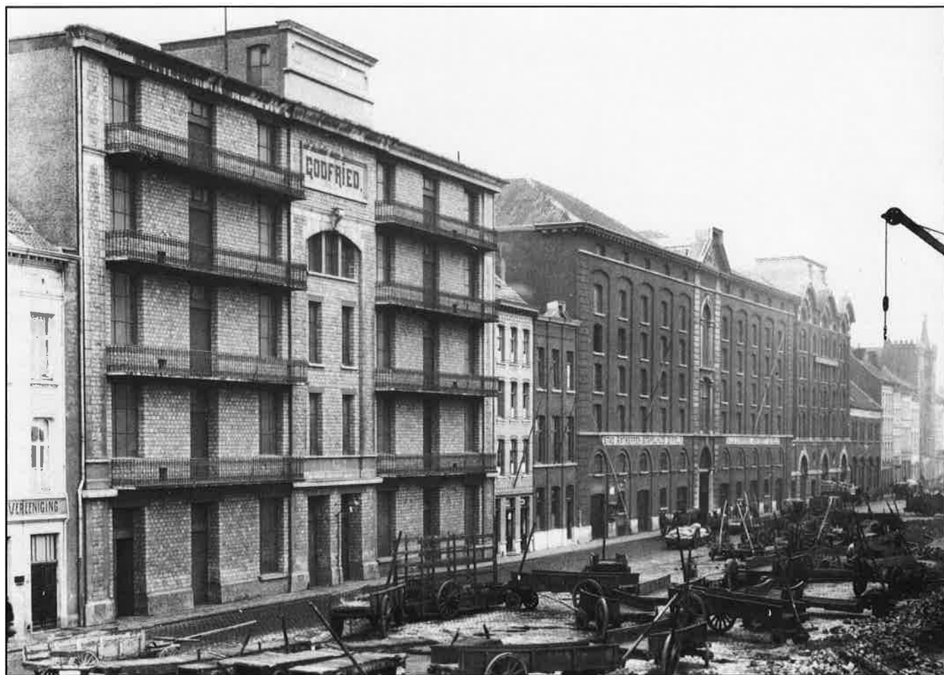
Antwerpse stapelhuizen Godfried (links) e.a., eerste kwart 20e eeuw. (uit: G. VANDERHULST ed. 'Industry, Man and Landscape', TICCIH, Brussel 1992)

(1139) H.VAN ROYEN, Wase transportplannen of een poging om een uitgebreider trein- tramnet uit te bouwen, 1900-1930 , in: Ons