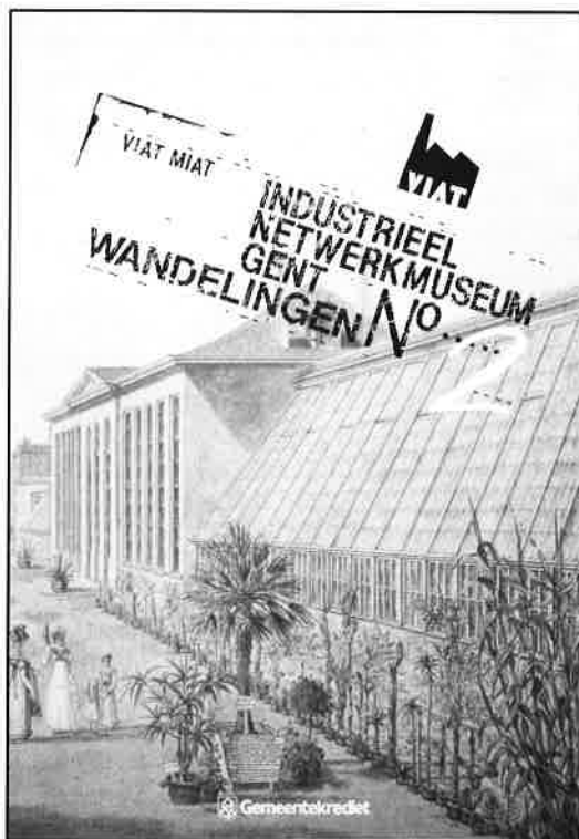
Industrieel netwerkmuseum Gent: Wandelingen n°2

pelijke bijdragen. Gent (V.I.A.T. & Gemeentekrediet), 1990. (1011) J.HEMELAERS & S.PUT, Beringen. Cité-route . Beringen (Monumentenzorg Beringen), 1992. (1012) Industrieel netwerkmuseum Gent. Wandelingen 1 . Gent (V.I.A.T. & Gemeentekrediet), 1989. (1013) J.NIJSSSEN & E.VANDEN-ABEELE, Molengids Voerstreek . Sint-Martens-Voeren (Werkgroep Molenzorg Zuid-Limburg), 1992.