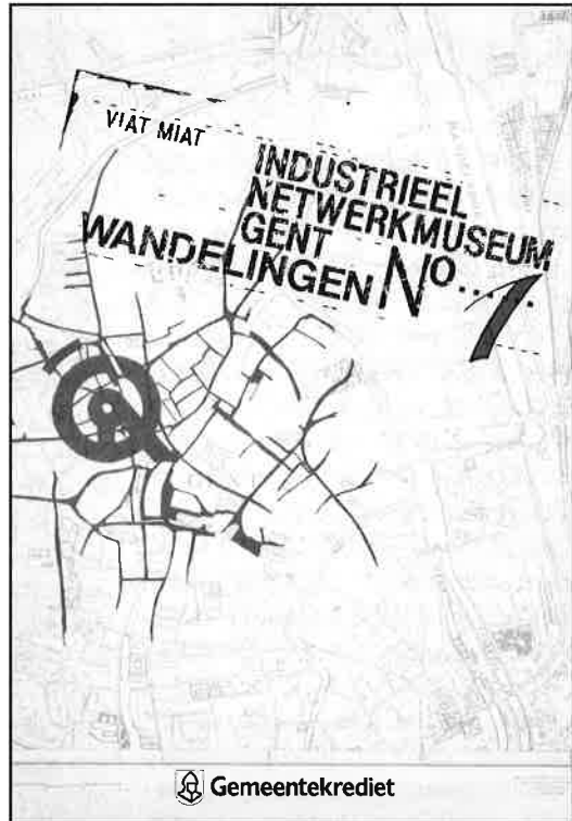
Industrieel netwerkmuseum Gent: Wandelingen n°1

(1010) R. DE HERDT, e.a., Gent, een stad van bloemen vroeger en nu . Wandelingen en wetenschap-