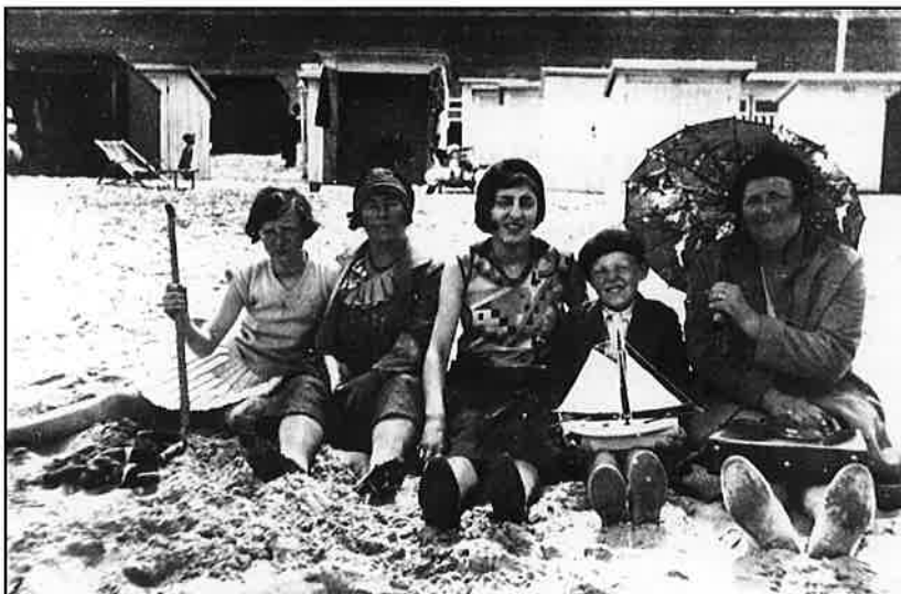
Aan zee in het Interbellum...

Ik ben in 1934 in deze wijk aangekomen. Ook in de Ham. Dat was een huurhuis, het vorige ook. We woonden daar met vier: mijn zus, mijn ouders en ik. Ik ben gevlucht in 1939 want ik zat bij 'de klas van