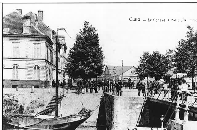
De drukte rond de Dampoort in het eerste kwart van de 20e eeuw

Mijn man heeft gewerkt tot zijn 70e jaar, tot zo'n drie jaar geleden.