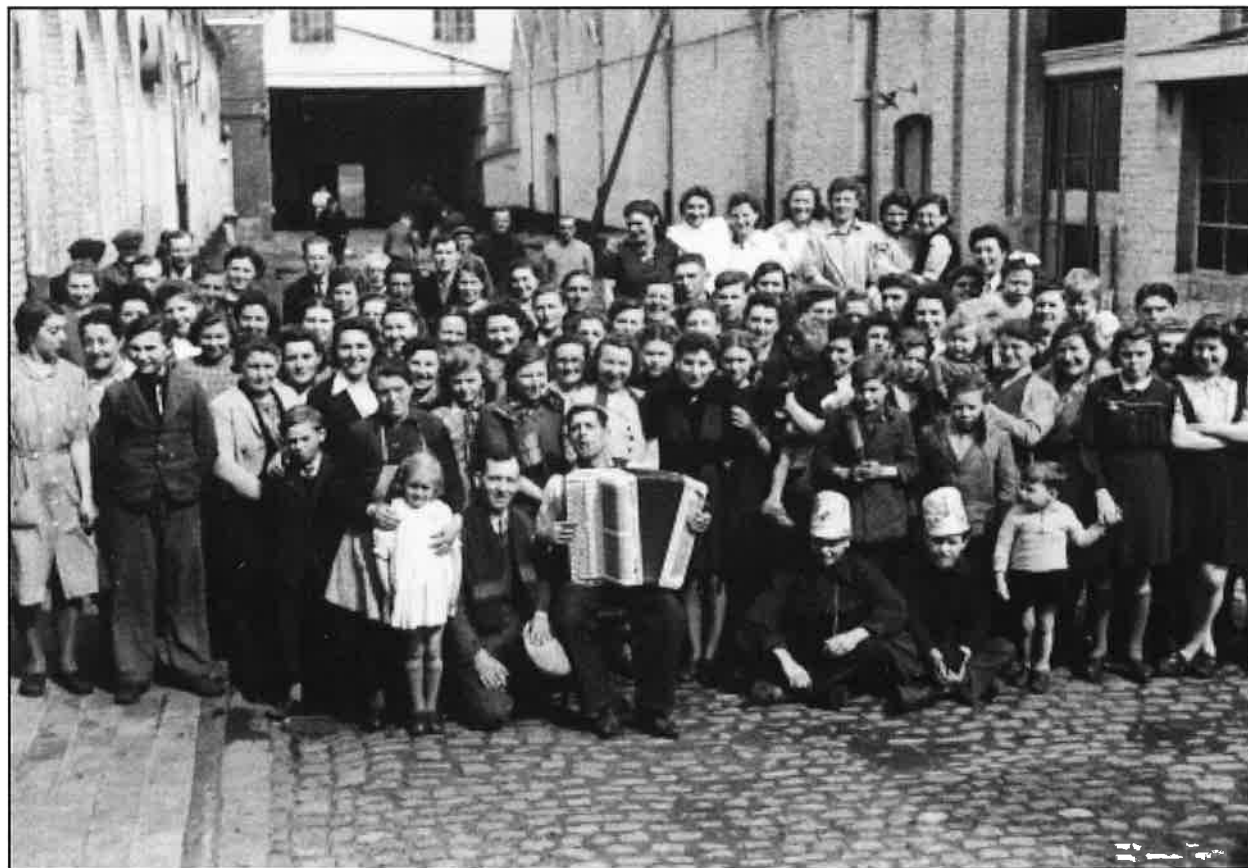
Bij de bevrijding : groepsfoto van arbeiders op de binnenkoer van de 'Texas' (Voortman)

ik op zo een zondag leren kennen in de dancing. Ik had twee kameraden, 'dochter van Jules de soldaat vanover de deur'. Toen ze trouwden stond ik helemaal alleen en had geen vriendinnen meer.