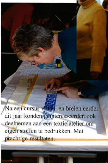
Na een cursus velen en breien eerder dit jaar konden geïnteresseerden ook deelnemen aan een textielatelier om eigen stoffen te bedrukken. Met prachtige resultaten.