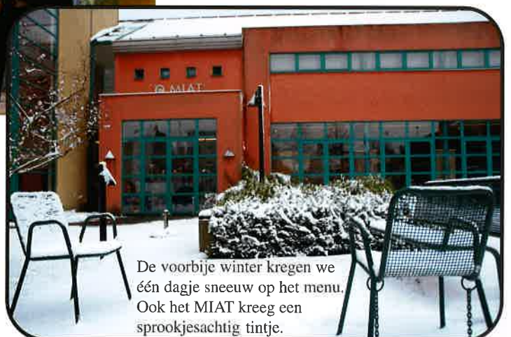
De voorbije winter kregen we één dagje sneeuw op het menu. Ook het MIAT kreeg een sprookjesachtig tintje.