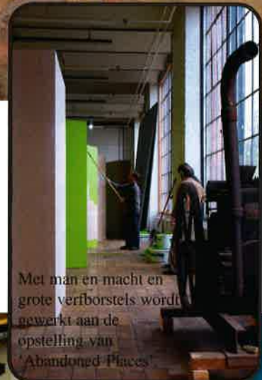
Met man en macht en grote verborstels wordt gewerkt aan de opstelling van 'Abandoned Places'