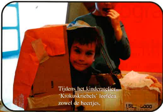
Tijdens het kinderatelier 'Krokusriebels' leefden zowel de heertjes,