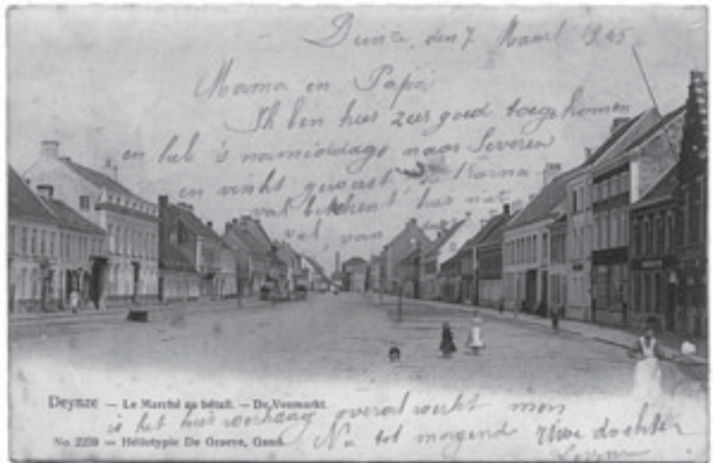
Boven: Een postkaart uit de oude doos, gedrukt bij De Graeve. Collectie MIAT (PK 340)

Op het einde van de jaren 1970 werd het bedrijf overgenomen door multinational Paragon, die op zijn beurt werd overgenomen door Moore. Vanaf de jaren 1950 was drukkerij De Graeve al gespecialiseerd in zigzagdocumenten of kettingformulieren die later zeer bruikbaar waren voor onder meer computers. Ook drukkerij Paragon specialiseerde zich verder in deze kettingformulieren. Maar in april 2004 vroeg Paragon het faillissement aan waardoor enkele tientallen mensen hun baan verloren. 000