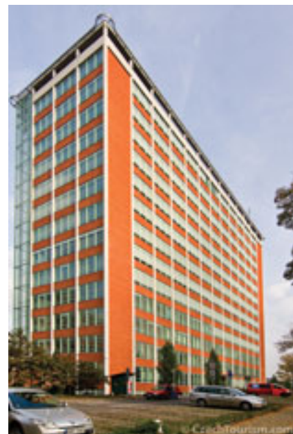
| Het vroegere hoofdgebouw van Bata.