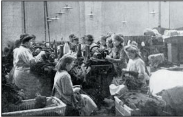
Project de Pers