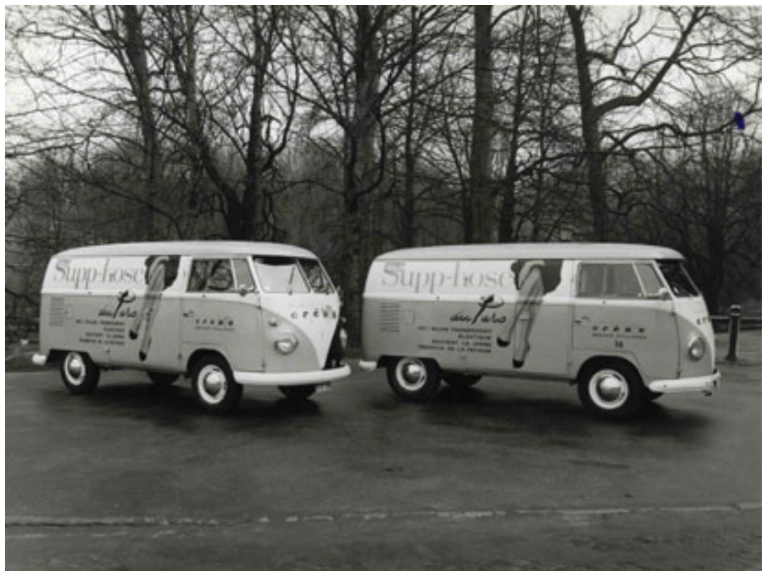
Na de oorlog ontstond een enorme vraag naar nylonkousen.

Hiermee verwierf "Bosteels" langzamerhand het monopolie over de hele binnenlandse productie van dameskousen en nadien panty's. Zelfs op internationaal vlak kreeg du Parc een standaardstatus toegerekend net zoals de naam du Parc in de regio Aalst een waar begrip werd. De merknaam was sterk geïnspireerd door de ligging van de fabriek, vlak naast het Aalsterse stadspark en was in het Frans omdat Parijs