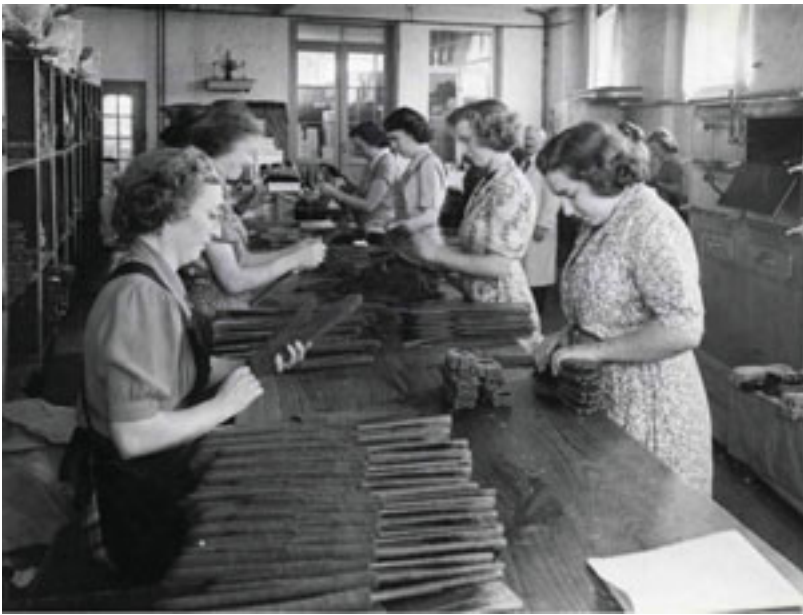
Tot 1965 produceerde 'Bosteels' handschoenen.

Bonneterie Bosteels – De Smeth. In de volksmond bleef iedereen het echter hebben over "Bosteels". De vennootschap had "de uitbating van een breigoedfabriek" als doel.