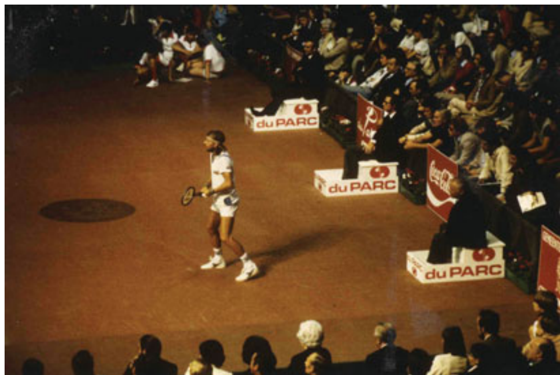
In 1981 tekende toptennisser Borg een contract om voortaan met du Parc -sportsokken te spelen.

Tijdens het bestaan van de NV Bonneterie Bosteels – De Smeth werd het archief van het bedrijf opgeslagen in de kantoren van de gebouwen in de Erembodegemstraat. Het dynamisch archief – de meest actuele dossiers en documenten die het bedrijf nodig had om zijn activiteiten uit te voeren –