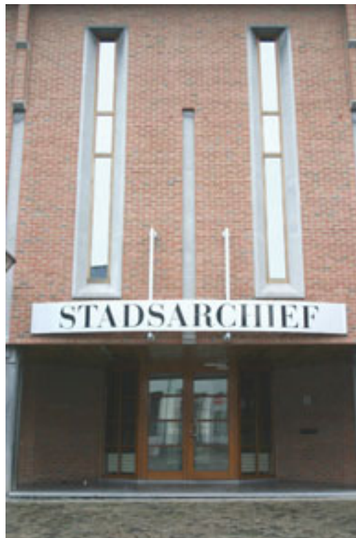
Zicht op het huidige stadsarchief van Aalst.

Maar verder werd alles bewaard. Het overgebleven