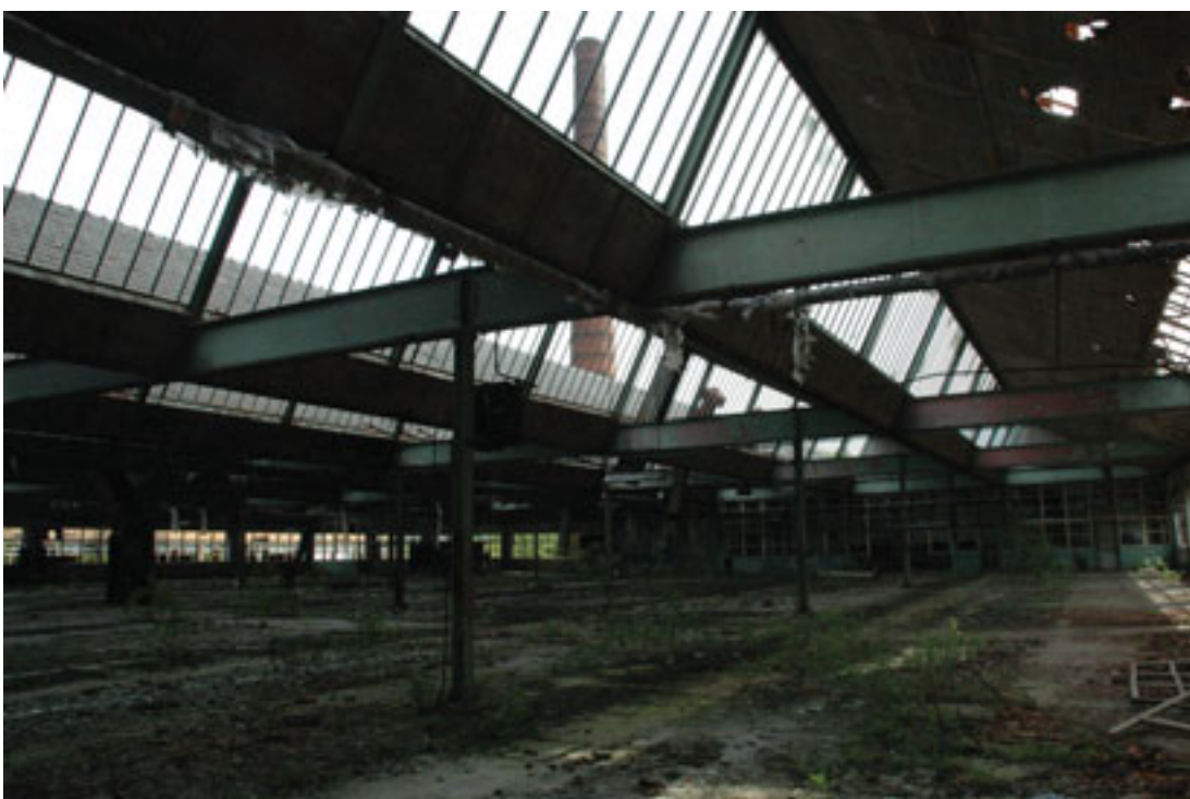
Een beeld op wat ooit de bloeiende leerlooierij Schotte was.