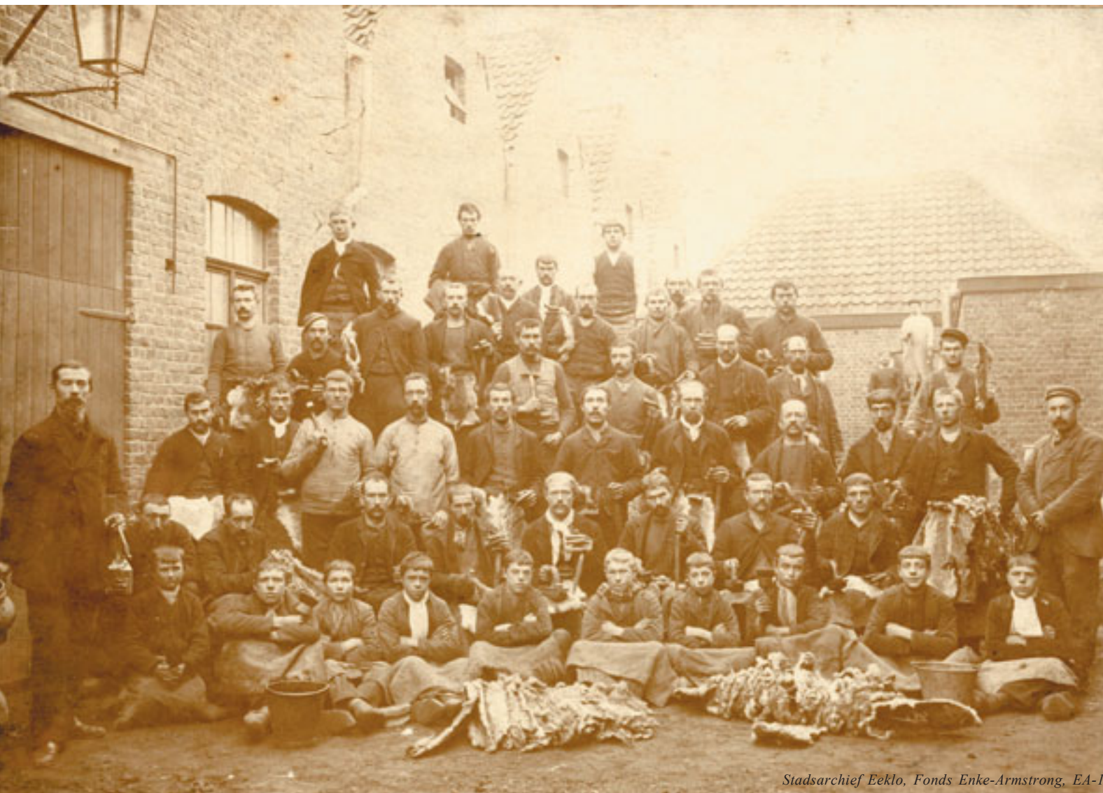
Stadsarchief Eeklo, Fonds Enke-Armstrong, EA-1

Op 19 mei 1914 werd in België de leerplicht ingevoerd voor kinderen tussen 6 en 14 jaar, gevolgd op 26 mei door een wettelijke bepaling waarin dezelfde leeftijdscategorie kinderen een algemeen verbod opgelegd werd om arbeid te verrichten. Glenn Hoens onderzocht in z'n licentiaatsverhandeling of deze wetten in de stad Eeklo hun doel bereikten. In onderstaand artikel vat hij zijn onderzoek voor u samen.