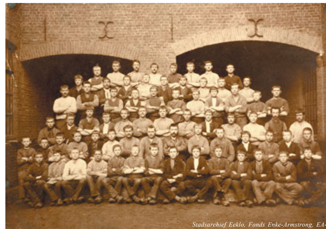
Stadsarchief Eeklo, Fonds Enke-Armstrong, EA-1

Om een verplichting in praktijk te realiseren, is een goed controlesysteem noodzakelijk. Dit vraagt echter tijd, administratieve maatregelen en gemotiveerde mankrachten. Door de oorlogsomstandigheden was