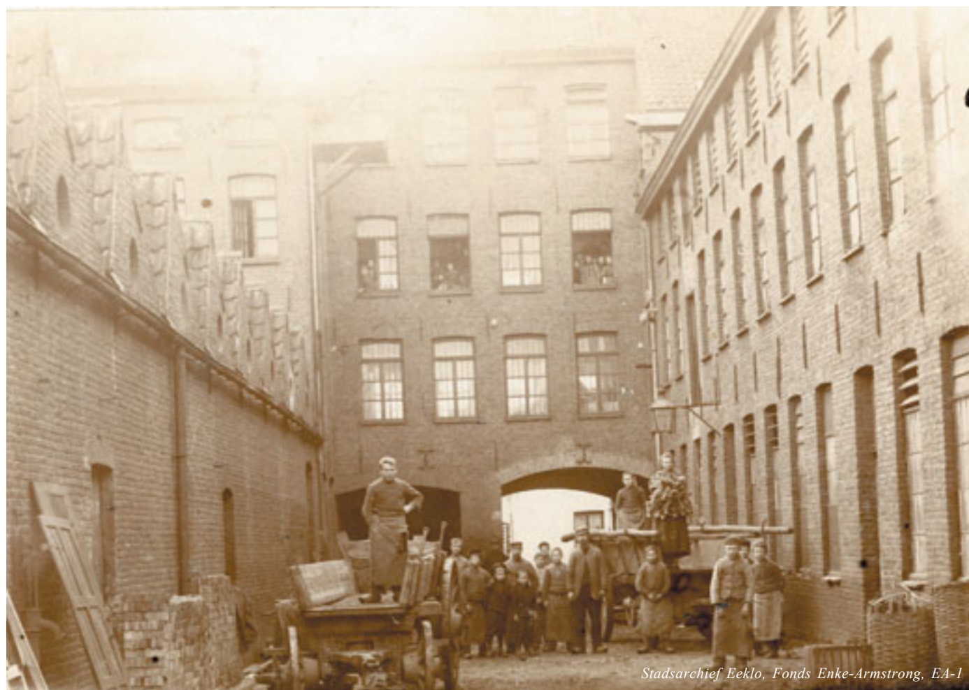
Stadsarchief Eeklo, Fonds Enke-Armstrong, EA-1