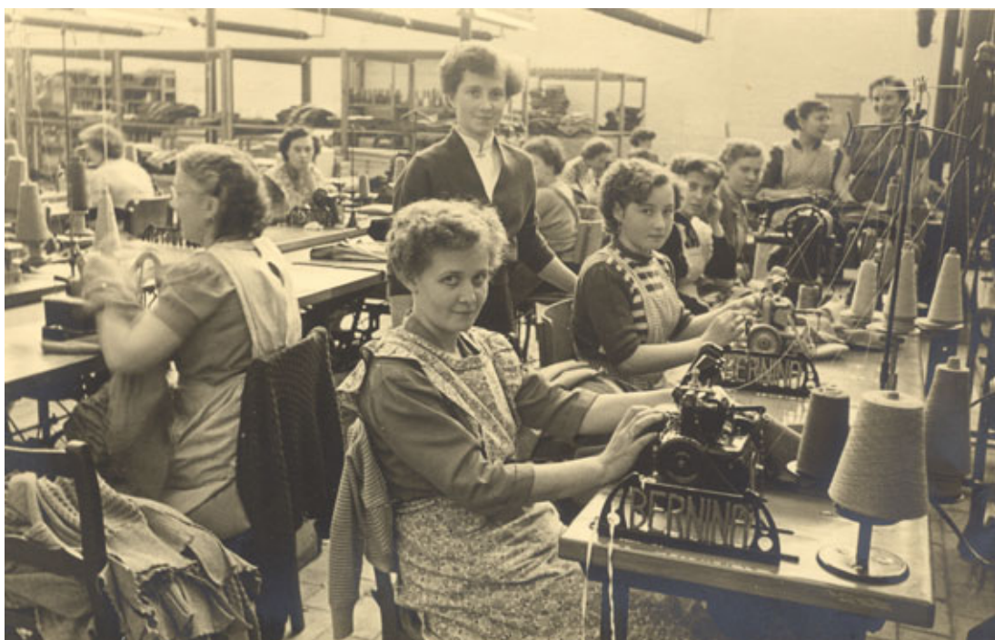
Confectieatelier, Heyman-Deschepper. SteM