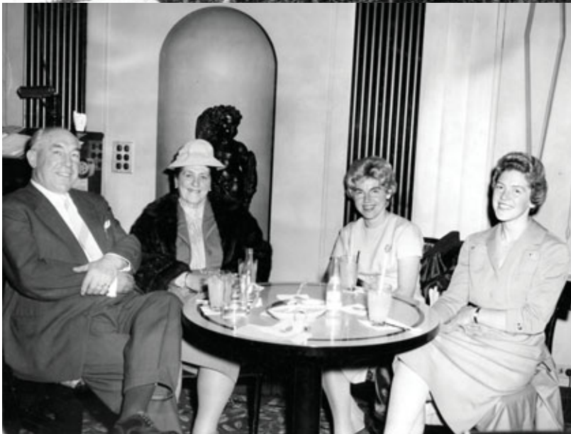
Boven: Een 'snijasse' aan het werk in de fabriek Epouse Jacobs